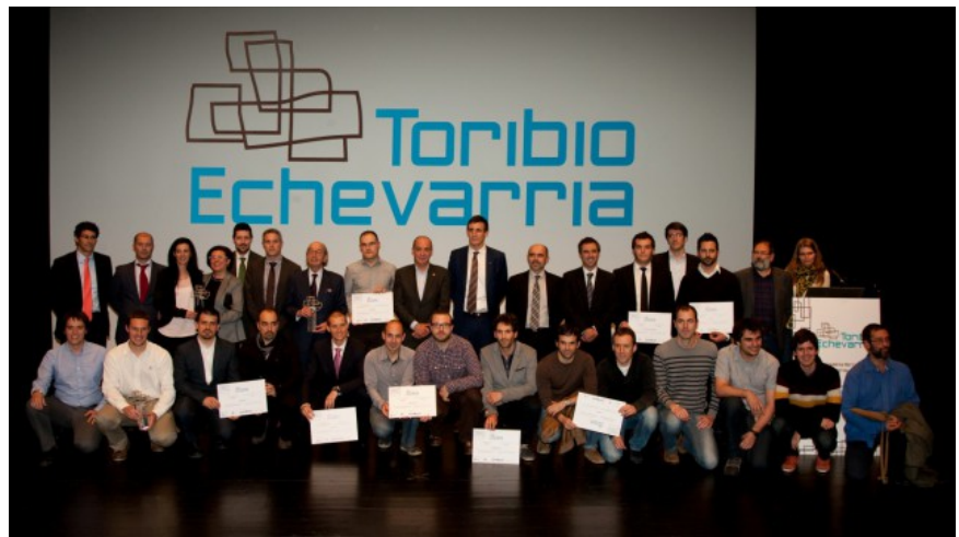
Foto de las empresas galardonadas a Premios Toribio Echebarria

El teatro Coliseo ha acogido esta tarde el acto de entrega de los Premios Toribio Echevarria 'Premios Euskadi al Emprendizaje Innovador' que alcanzan ya su vigesimocuarta edición. En total han sido 40 las candidaturas que se han presentado en todas las categorías del certamen: 30 en el apartado de "Ideas /Proyectos Empresariales" y 10 en la categoría de "Nueva Empresa".