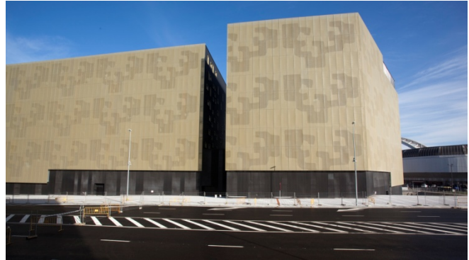
Escuela de Ingeniería