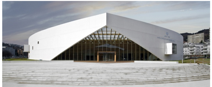
Centro Carlos Santamaría