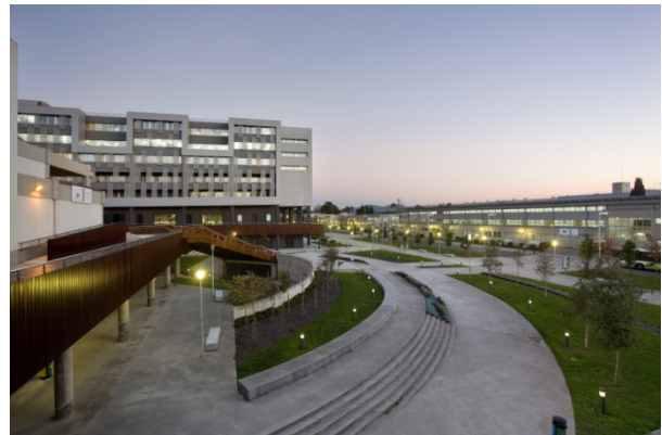
Vistas generales Area Leioa-Erandio