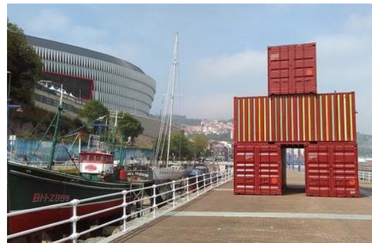
"Contenido contenido", 2015. Juan Malk.