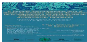
2016ko otsailak 26

Garapen Iraunkorrerako Helburuak: politiken koherentzia eta genero ikuspegiak dituen inplikazioak II Jornada Iberoamericana para el diseño de medidas eficaces de control de resistencia a los antibióticos