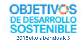
2015eko abenduak 3

Garapen iraunkorraren helburuei buruzko jardunaldia Bizkaiko Campusean