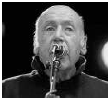
Laboa, en su apogeo.

LA UPV Y LA DIPUTACIÓN, IMPULSORAS DE LA CÁTEDRA, PRESENTARON AYER DIVERSAS BECAS