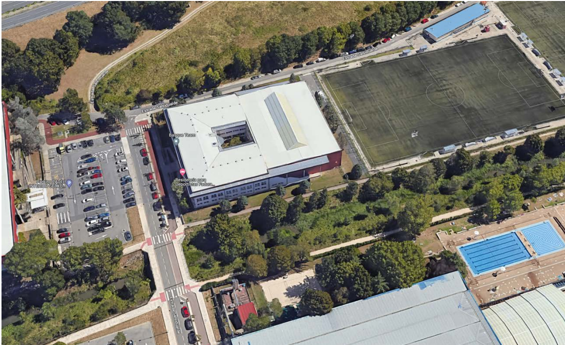
Vista general del CPT-Basque Team