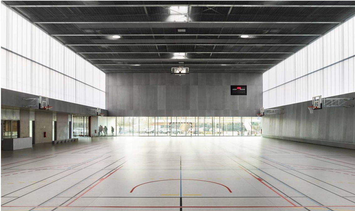
Strasbourg sports hall / Coulon Arch / 2018