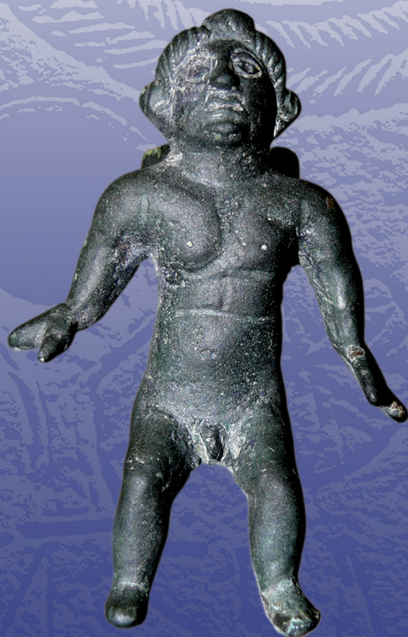
Fotografía de Eros, procedente de Mariturgi. Cortesía de Julio Núñez.

Este Máster de Investigación da acceso a un Doctorado Interuniversitario en Ciencias de la Antigüedad (UPV/EHU y Universidad de Cantabria), dirigido por la UPV y en el que también participan profesores de las Universidades de León y Oviedo.