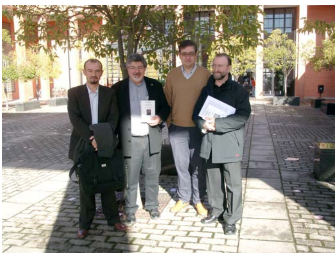
Presentación del libro Historia del País Vasco. Tomo IV 10/11/05