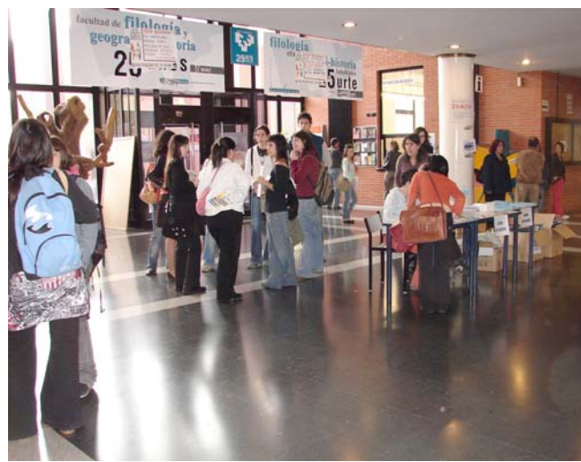
Jornadas de Puertas Abiertas 2006 2006ko Ate Irekiko Jardunaldiak 27-28/03/06