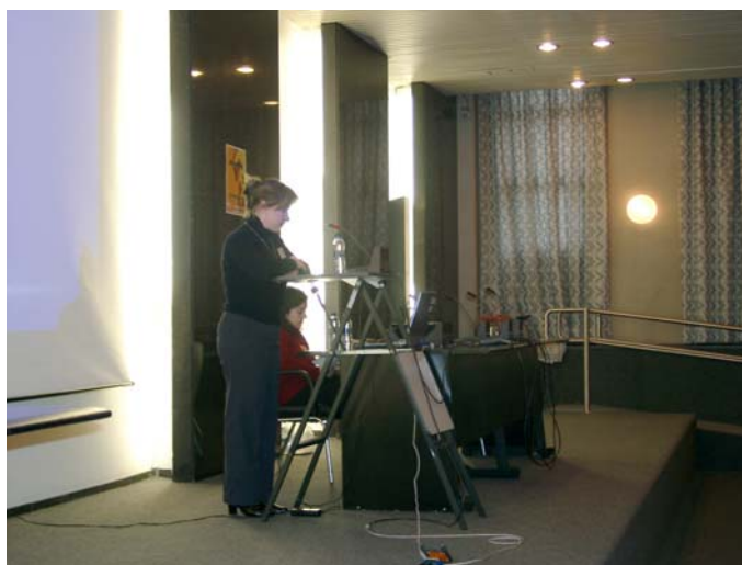
Nazioarteko Hizkuntzalaritza Konferentzia 14th console Conferencia Internacional de Lingüística 28/09/05-30/09/05