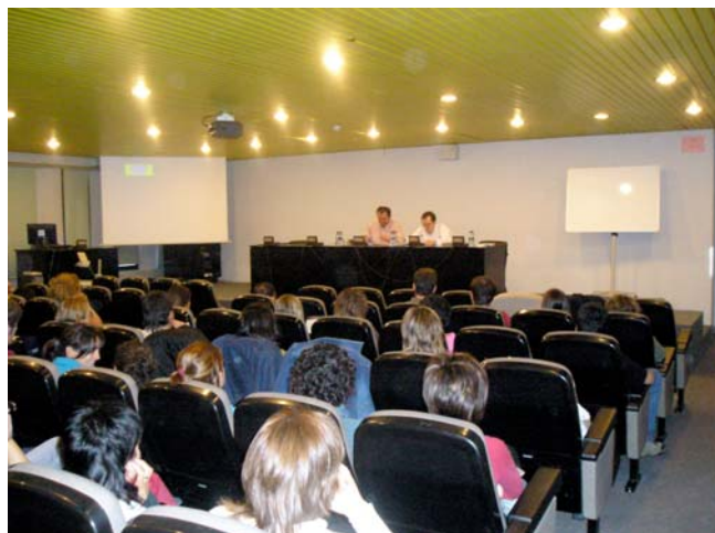
VIII Jornadas La Historia a través del cine 04-05/10/05