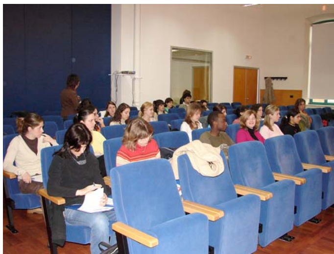
II Seminario Práctico de Traducción e Interpretación 15/12/05-17/12/05