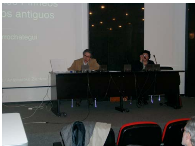
Los tiempos antiguos en los Territorios Pirenaicos 10/11/05-11/11/05