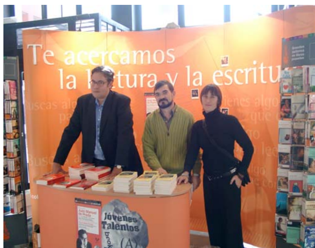
Conferencia de Juan Manuel de Prada 11/11/05