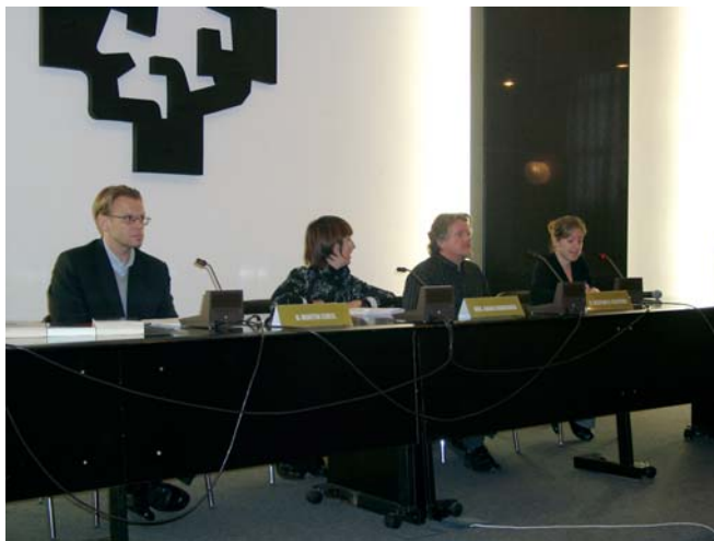
Jornadas sobre literatura nórdica 11/11/05