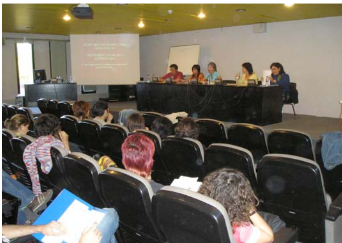
Seminario de Traducción Audiovisual 28/09/05-30/09/05