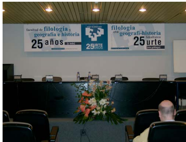
Facultad de Filología y Geografía e Historia 25 años Filologia eta Geografia-Historia Fakultatea 25 urte 23/11/05-25/11/05 y 12/12/05-16/12/05