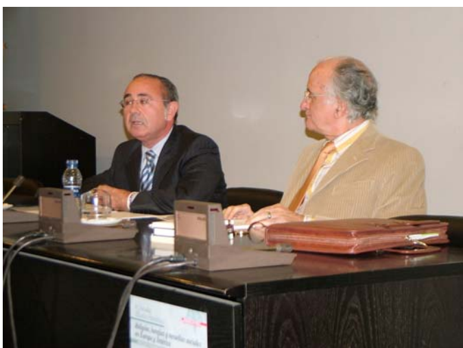
VII Jornadas de Estudios Históricos 08/11/05-10/11/05