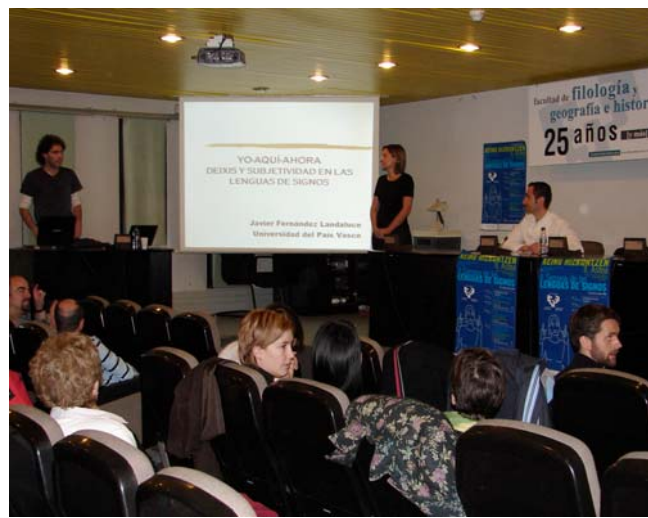
II Semana de las Lenguas de Signos 22/05/06-26/05/06