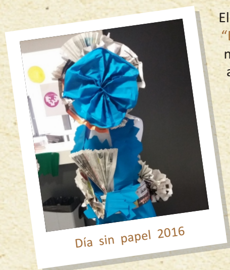
Día sin papel 2016

El pasado 16 de diciembre, por cuarto año consecutivo, se celebró en la Facultad el “Día Sin Papel”. La buena acogida de los tres últimos años nos animó a organizar un nuevo Día Sin Papel y a consolidarlo como un día propio de la Facultad. Como en las anteriores ediciones, el objetivo de esa jornada era invitar a reflexionar acerca del uso que hacemos del papel de cara a reducir su consumo.