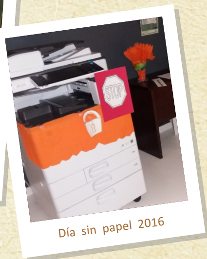
Día sin papel 2016