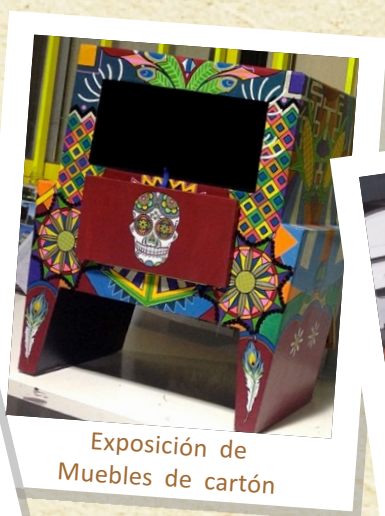
Exposición de Muebles de cartón