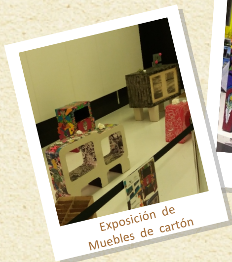
Exposición de Muebles de cartón

El año pasado tuvimos, en la entrada de la Facultad, algunos de los vestidos que participaron en las últimas ediciones del Concurso Internacional de Vestidos de Papel de Güeñes. Este año hemos contado con una exposición distinta: gracias al taller TRATE se expusieron en la entrada de la Facultad muebles hechos con cartón.