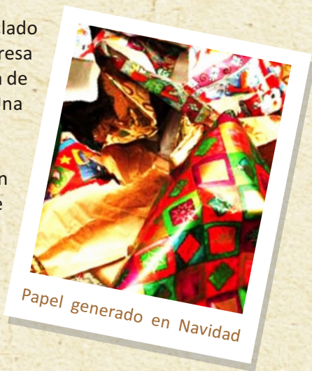
Papel generado en Navidad

CEOE: http://www.ceoe.es/es/contenido/actualidad/noticias/repacar-calcula-que-cada-espanol-reciclara-2-kilos-de-papel-y-carton-en-navidad