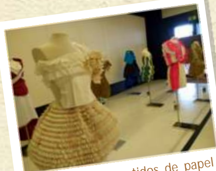
Exposición de vestidos de papel en el Hall de la Facultad

Además, este año, el Día Sin Papel, estuvo acompañado con una exposición muy especial: hemos tenido la suerte de poder exponer en la entrada de la Facultad una decena de vestidos que han participado en las últimas ediciones del Concurso Internacional de Vestidos de Papel de Gueñes . Una muestra de las cosas tan fascinantes que es posible realizar mediante un uso apropiado del papel. Desde el equipo de Ekoscan queremos agradecer a Enkartur el habernos prestado los vestidos para el Día Sin Papel de la Facultad.