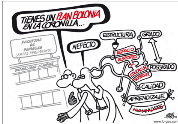
Antonio Fraguas, "Forges", umorista, Madril, 1942-2018