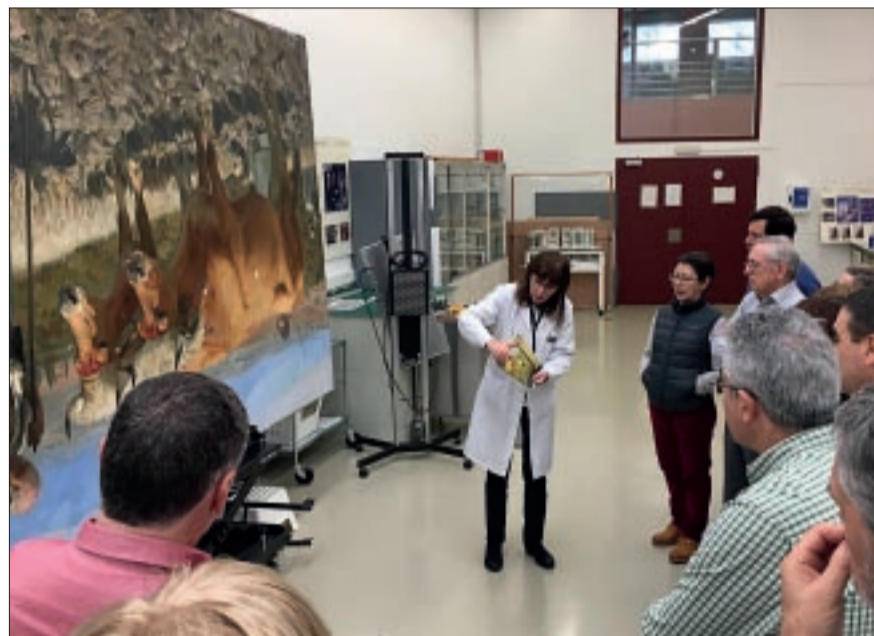
A la visita asistimos 16 estudiantes de las Aulas.

En las áreas de Pintura y Escultura trabajan desde 2015 en el proyecto del conjunto de relicarios de Mártioda, con más de 17 cráneos (del s. III d.C. según estudios del C-14, como en la leyenda) con adornos textiles de bordados y encajes (s. XVII), el mueble relicario y sus vitrinas. Este conjunto estaba en la sacristía de la Iglesia de San Juan Evangelista de Mártioda, y fue adquirido por la Diputación de Álava en los años 70. El estado de conservación de este conjunto era mediocre, lo que explica la larga duración de los trabajos. Esperan terminar la restauración este año, y habrá que decidir a continuación dónde instalar este verdadero tesoro del patrimonio artístico de Álava.