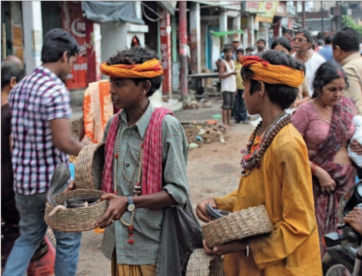
El sistema de castas Hindú y sus leyes de pureza quedaron hondamente arraigados en la cultura india. Carlos Guréndez.

La palabra «casta» ya no se pronuncia, pero sigue dominando del discurso político.