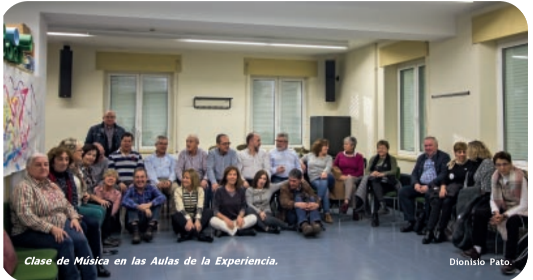
Clase de Música en las Aulas de la Experiencia.

Centrándonos en nuestro entorno más cercano, es evidente que el panorama musical en nuestro país ha sido históricamente desolador. En el ámbito clásico o académico, desde Tomás Luis de Victoria hasta Manuel de Falla esto ha sido un páramo; y en el terreno popular-ligero también llegamos varios compases tarde a la revolución juvenil de Presley y Beatles en los años 50 y 60 del siglo pasado en EEUU y Reino Unido. En lo referente al aprendizaje musical, aquél que quería estudiar música de una manera oficial y sería solo tenía dos opciones: o irse a un Conservatorio, si es que tenía tiempo, ganas y dinero, o haber nacido en familia burguesa o noble, así se podía permitir el lujo de pagarse unas clases o largarse al extranjero. Para el aficionado que no quería embarcarse en unos estudios musicales reglados en un centro oficial surgieron a finales del siglo pasado las llamadas Escuelas de Música, más orientadas como forma de pasatiempo o distracción y fuera del horario escolar. Por último, la situación de la música dentro de la educación general en colegios e institutos (Educación