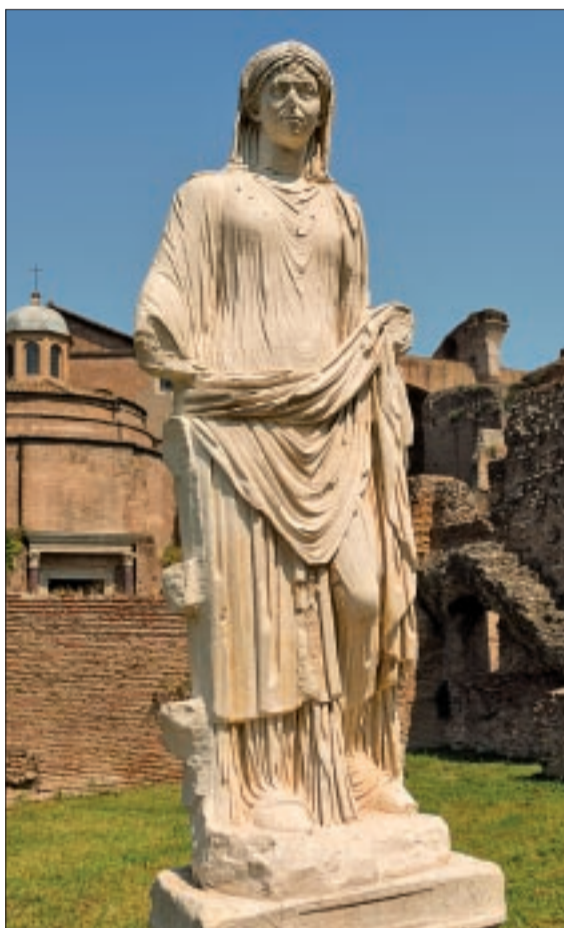
Sacerdotisa, virgen vestal romana.

En el mundo del antiguo Egipto, la presencia de la mujer en el clero fue clara y notoria, formando un grupo importante en la estructura jerárquica sacerdotal. Igualmente, en el culto realizado por mujeres sacerdotes a las diosas del Olim-