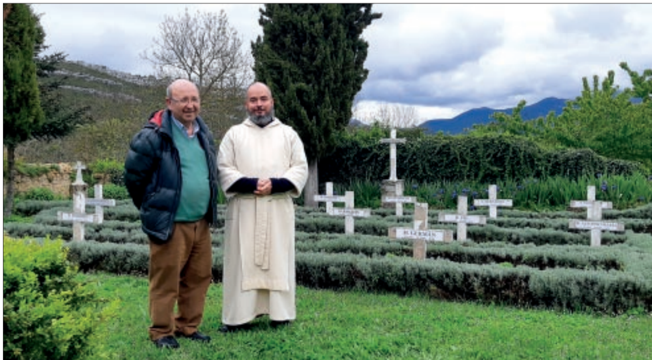
Desde el año 2004, solo si eres hombre, puedes solicitar una estancia en una de las 4 habitaciones disponibles.

A los monjes lo que ocurre fuera del yermo no les preocupa, por ello no reciben noticias. Su familia la forman ellos mismos y su música es el Gregoriano y el murmullo de los pájaros. Están convencidos de que se unen con Dios en la oración, el silencio, la soledad y la paz.