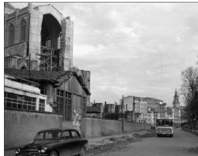
Calle Monseñor Cadena y Eleta, 1962.

El Hospital de Santa María se trata del establecimiento benéfico más antiguo de la ciudad aunque no podemos conocer todavía ni cuando ni por quién se fundó. A principios del siglo XVI se derribó por completo para reconstruirlo a unos pocos metros de su ubicación primitiva.