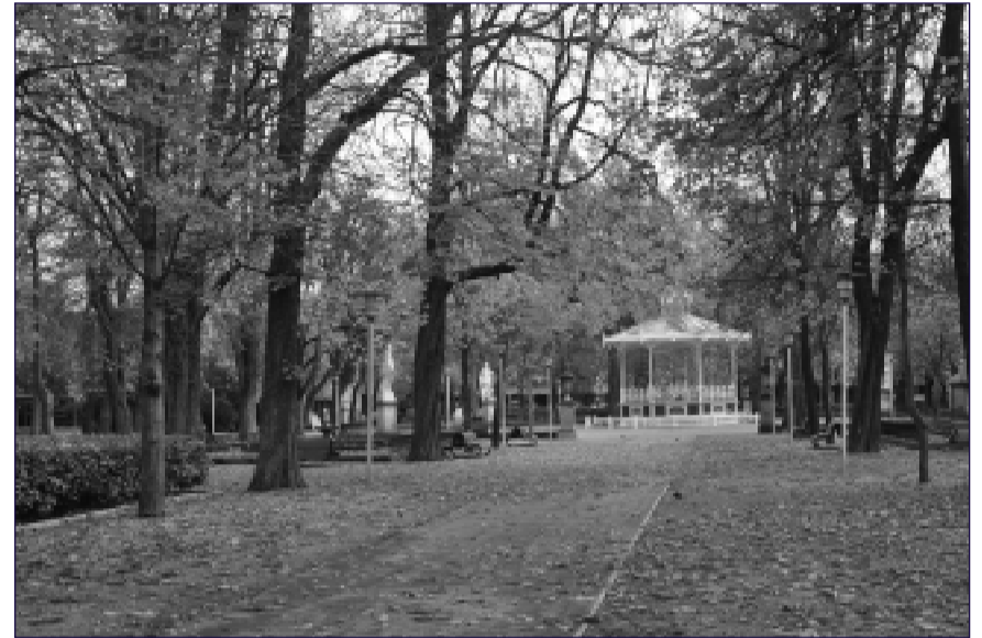
El parque de La Florida es el pulmón céntrico de la ciudad.

El premio generará actividad científica, divulgativa y económica.