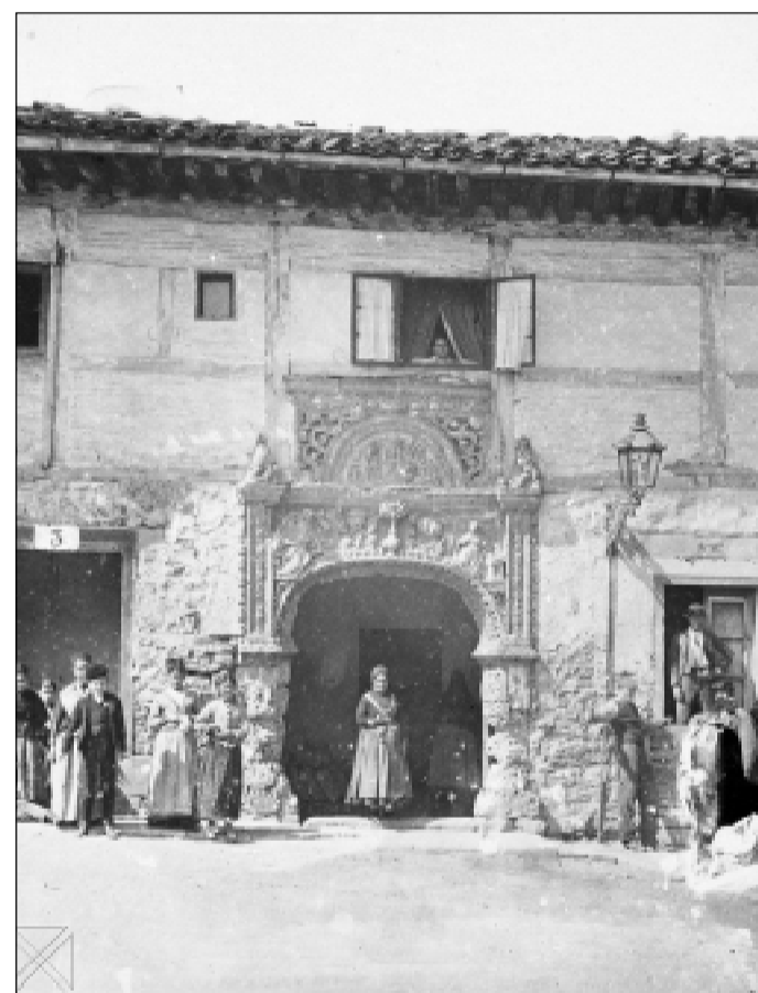
Hospital hacia finales del siglo XIX.