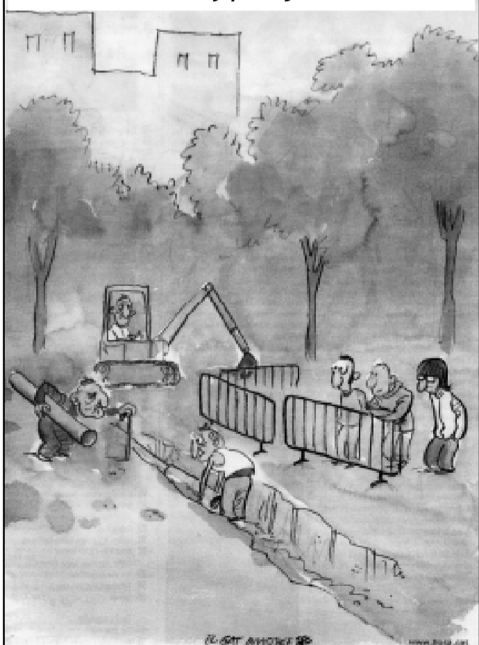
EL GAT INVISIBLE. Publicado en EL TEMPS, 9-02-10.