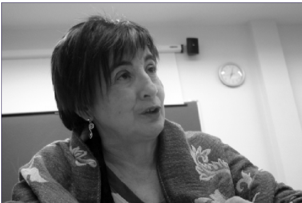
Juncal en la entrevista.