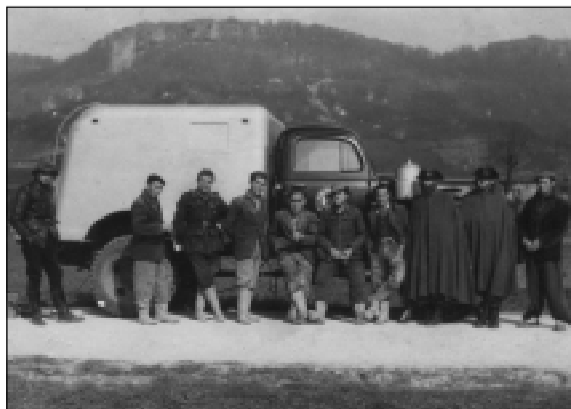
Sondeos en Urbasa, 1953.