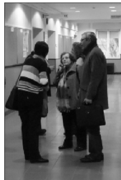
Socios de ACAEXA. J. Larreina.

Por último, ACAEXA muestra su preocupación por la escasa participación de los socios en la vida de la asociación. Así, por ejemplo, en la última asamblea, de los 268 socios, solamente acudieron 28.