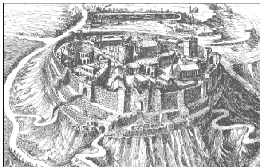
La ciudad de Calahorra hace 2.000 años.

Pamplona fue la gran ciudad medieval de Navarra, dentro de Navarra que tenía una escasa guarnición y donde la conquista fue precaria. Calahorra, la otra gran ciudad, poseía una fuerte guarnición permanente. Durante 300 años (del 714 al 1045), desangrada por todos, fronteriza y rica. Historia y fechas de batallas hasta la saciedad. Sancho Garcés I, que vivía de forma habitual en su palacio de Calahorra, quiso hacerla capital del Reyno, pero al reconquistarla los moros, el poder político pasó a Nájera.