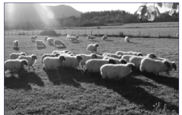
El rebaño pastando en Larrea.