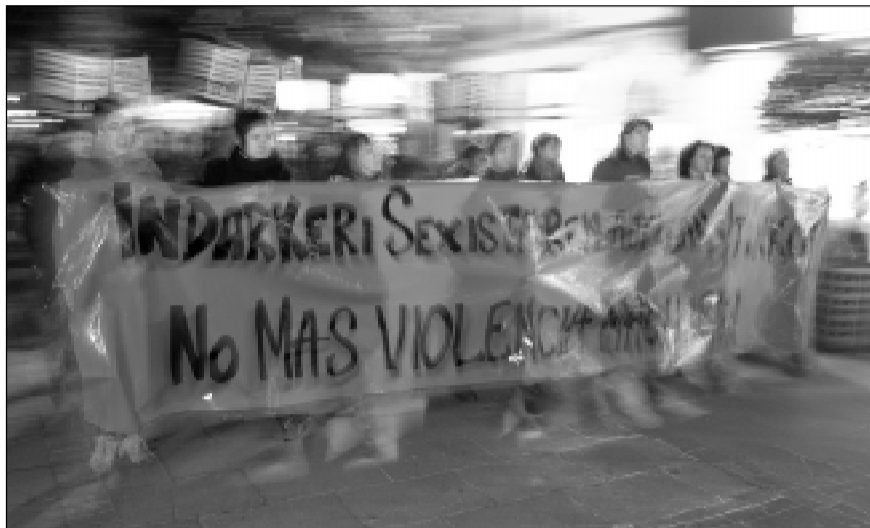
Vitoria-Gasteiz, 25 de noviembre de 2011.

«Nada cambiará si los hombres no se implican», insiste R. Bacete, miembro de Gisonduz, una iniciativa pionera del Gobierno vasco impulsada por Emakunde (Instituto Vasco de la Mujer) dirigida a promover la concienciación, participación e implicación de los hombres en pro