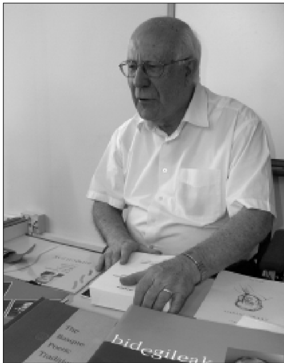
Gorka nos muestra sus libros.

Por diferentes razones que le duele recordar, por lo que no quisimos insistir, nos cuenta que en 1975 tuvo que irse a Estados Unidos donde permaneció catorce años. Allí, se estableció en Reno y comenzó a escribir su libro Basque English Dictionary , en 1979. Fue en esta ciudad del estado de Nevada donde escribió su primer artículo Les Romantiques en Pays Basque . En el año 1989 regresó. Le pedimos que elija entre la República del Congo y Estados Unidos. Sin dudar, dice que preferiría volver al país africano, a pesar de creer que la situación social ha empeorado debido en gran medida a su pasado colonial y a la corrupción de sus gobernantes.