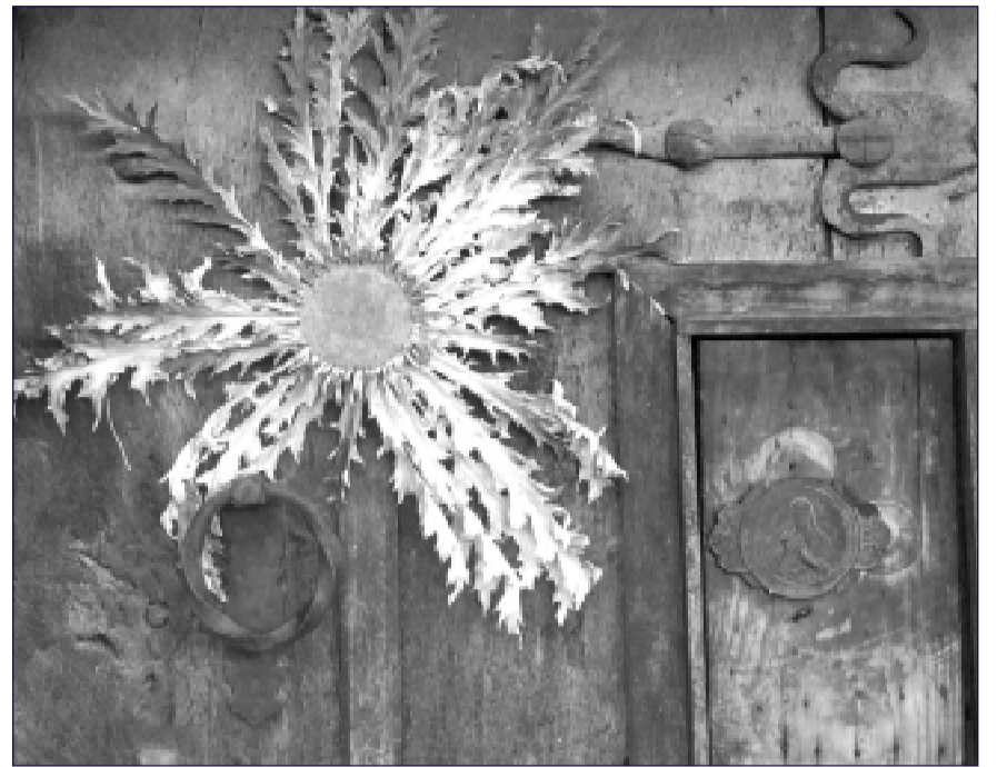
Dos formas de protección: el Eguzkilore y la imagen de la Virgen.

En lo mítico, el hada es la parte buena de la madre y la bruja la parte mala.