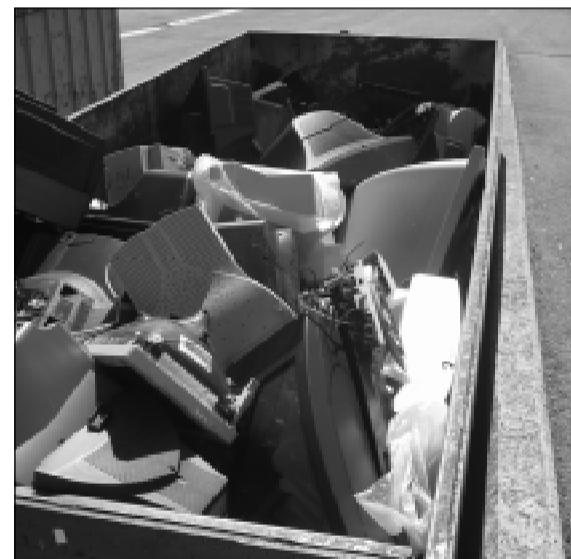
Punto Verde en la Avenida de los Huetos.

Es una consecuencia más de esta economía del despilfarro y del hiperconsumo en que estamos inmersos, ya que seducidos por la publicidad y el marketing de las grandes compañías del mundo parece que estamos obligados a COMPRAR, TIRAR Y VOLVER A COMPRAR. Si queremos un futuro mejor para nuestro planeta será necesario reflexionar sobre nuestros hábitos de consumo y tratar de conseguir un planeta más limpio y sostenible para nuestros hijos.