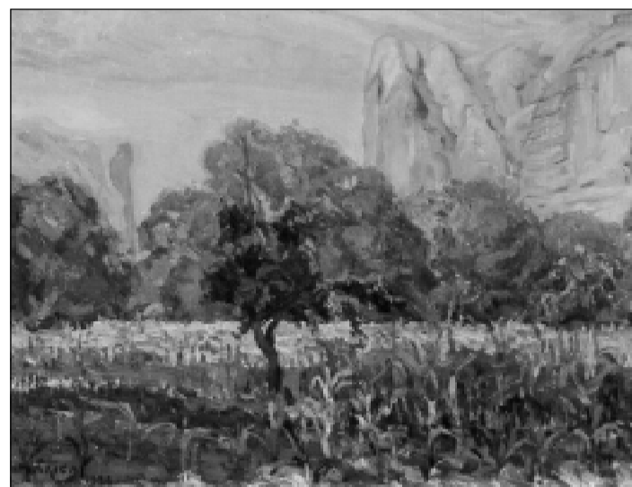
Vega de Islallana, 1926.