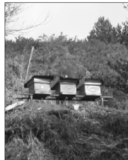
Colmenas en Arlobi (Sarria).

La Jalea Real es un gran constituyente. Contiene varias vitaminas B, ácido fólico, antibióticos y minerales. Suele ser un alimento muy valorado por los macrobióticos. Y por último la cera es el material que utili-