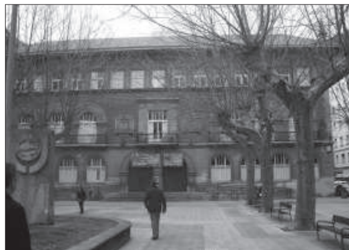
La Escuela de Artes y Oficios se fundó en el año 1774.

Sobre el actual estado de este centro educativo, los propios estudiantes han tenido que dedicar su dinero a la compra de materiales para poder realizar sus trabajos artísticos. Al mismo tiempo pudiera parecer interesante posponer en la escala de interés social a la EAO, dado que no está vinculada con el desarrollo económico y empresarial. Pero veamos el espíritu que rige estas actividades. Los alumnos acuden a este centro porque les llama su vocación, sin plantearse de principio la obtención de un puesto en una empresa que les procure una contraprestación. Acuden solamente por el gozo de crear una obra de arte que ilumine su espíritu. Ese es su beneficio. Extrañas criaturas en este sociedad materialista en el que todo se mide por el «tanto tienes, tanto vales». ¿Qué sería de este mundo sin Leonardo, sin Velázquez, sin Miguel Ángel y sin alumnos que han pasado por este centro como Olaguibel, América y Olano que han iluminado la existencia de la Humanidad? Sería un mundo mucho más triste, incluso sombrío. He aquí su valía. La EAO se nutre de fondos de subvención de instituciones públicas y con los importes de las matrículas. Teniendo en cuenta lo expuesto y la situación de recortes generalizados que se está produciendo en todo el Estado parece interesante poner en marcha la iniciativa.