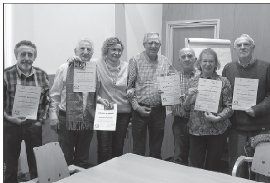
Personas premiadas en el concurso cultural.