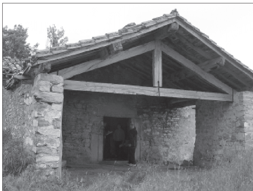
Molino de Mendoza antes de ser rehabilitado.

Junto a la tolva destaca una especie de grúa de madera con dos ganchos de hierro llamada cabria que se utilizaba para sustituir la piedra alisada por el uso, cambiándola por