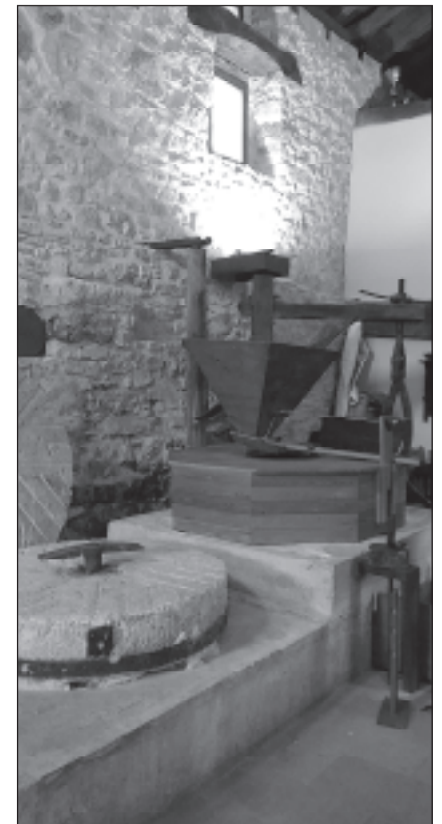
Molino de Adana.