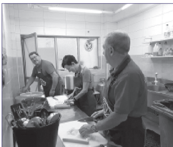
Cocinando en el Victoria Center.