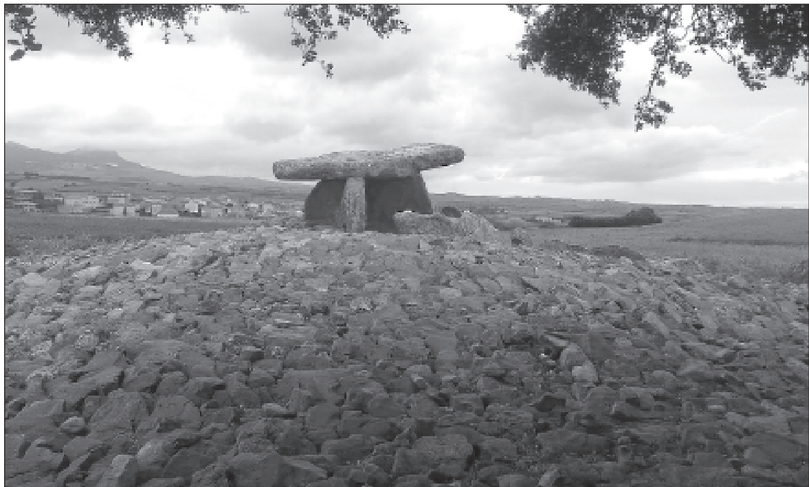
Dolmen de La Hechicera, en las cercanías de Elvillar.

Si recorremos la zona, vemos una serie de pueblos que van desde Briñas, hasta Viana o Bargota. La mayoría forman parte de la Rioja Alavesa, pero Briñas, Ábalos y San Vicente de la Sonsierra pertenecen a la provincia de La Rioja, y Viana y Bargota a Navarra, aunque todos ellos, eran del antiguo Reino de Navarra. Para complicar más todo, Briñas, San Vicente y Ábalos, junto con más pueblos del otro lado del Ebro, forman parte de La Rioja Alta y los de Navarra de Rioja de Navarra. Lo que no ha separado el terreno lo ha hecho la política, tenemos tres comunidades autónomas pero siete fragmentos inconexos de terrenos: Briñas, vendida a Haro a principio del siglo XIV; San Vicente y su alfoz, conquista militar en 1461, donación del rey de Castilla al Conde de Ureña y venta en 1516 a la esposa del conde de Haro, en ese momento Merindad Burgalesa de Rioxia a la que Haro pertenecía; Assa-Oyón-Moreda, donada por el Rey de Castilla a Logroño tras guerra en 1430. En 1461 el rey devolvió a Laguardia parte del territorio y el resto se quedó en Logroño. En el límite del Este, Lapoblación y Bargota, permanecieron en Navarra al no ser conquistadas por Castilla; y Viana, conquistada por Castilla en 1461, pero en 1523 se devolvió a Navarra.