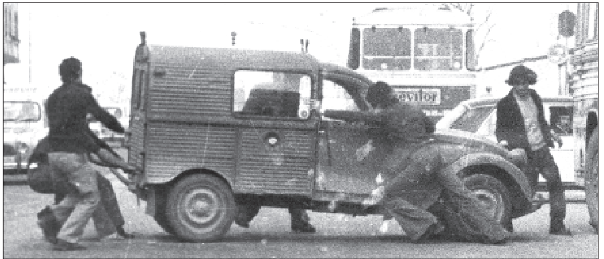
Manifestantes realizando una barricada.

Sentimos temor en ese momento, pero yo creía, y así se lo dije a mi compi, que no entrarían,