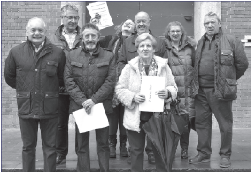
Entrega de premios del concurso cultural.