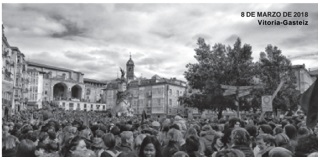
8 DE MARZO DE 2018 Vitoria-Gasteiz

Avala una igualdad de remuneración sin que haya discriminación alguna por razón de sexo , y a pesar de ello se pueden ver grandes desigualdades retributivas entre mujeres y hombres que generan una, cada vez más profunda, brecha salarial que aumenta año tras año y que repercute directamente en las prestaciones y en las pensiones.