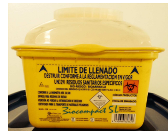
Cortantes y punzantes