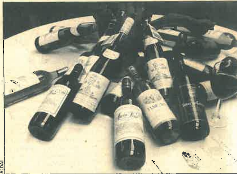
Son vinos «verdes» al gusto pero de gran sabor.

Se estima que los gastos de funcionamiento serán de 30 millones de pesetas en el año 1988; 36 en el 89; 43 en el 90; 52 en el 91; 62 en el 92; y 70 en el 93. A estas cifras habrá que sumar la cantidad de 100 millones en el año 90 y otros 100 para el 91, en concepto de gastos para equipamiento básico (aulas, laboratorios).