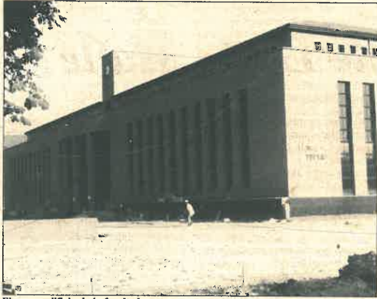
El nuevo edificio de la facultad.

La Biblioteca de la Facultad dispone de un fondo bibliográfico de unos 60.000 títulos monográficos y más de 1.000 títulos de revistas, siendo de libre acceso el 70% de dichos fondos. Estos se incrementan anualmente con unos 5.000 títulos nuevos. Dispone de una sala de investigación dotada de 89 plazas, con una sección del libro antiguo y microformas,