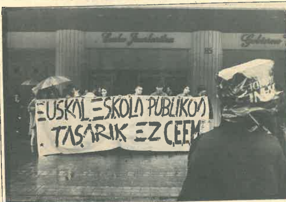
Estudiantes de Enseñanza Medias se manifestaron ayer en Bilbao.

En Bilbao, unos doscientos jóvenes recorrieron la Gran Vía de Bilbao y se concentran ante la delegación del Gobierno vasco, junto al Sagrado Corazón, coreando frases a favor de «una escuela pública vasca» y «no a las tasas».