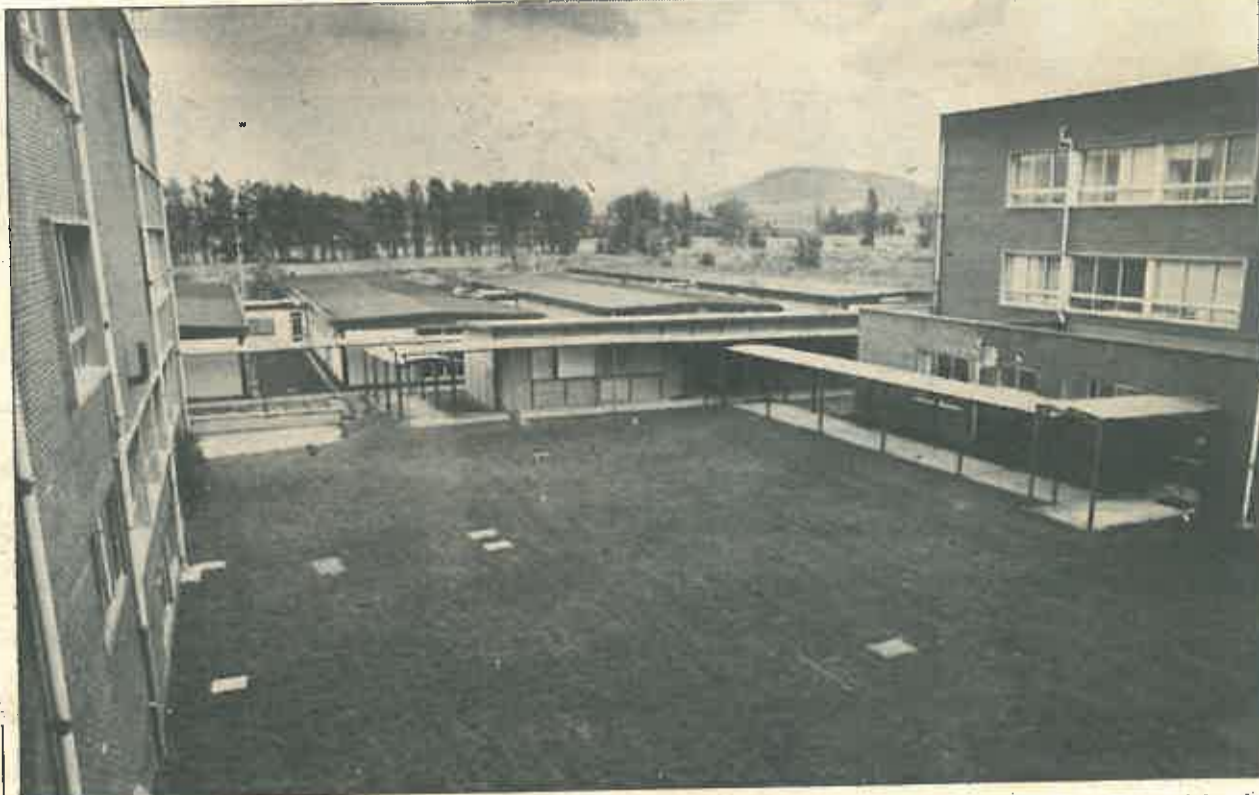
El Colegio Universitario de Alava se transformará en Facultad e impartirá tres nuevas titulaciones a partir del próximo curso.