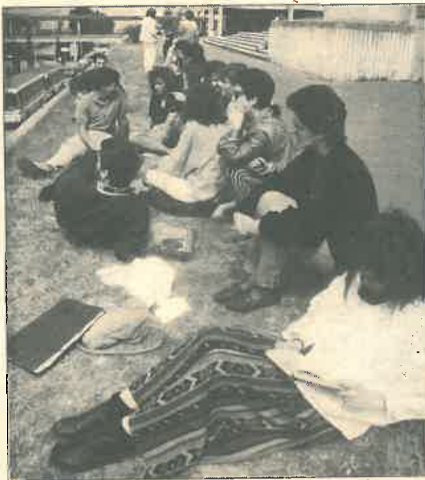
Dos de las titulaciones serán innovadoras en el panorama universitario español

El centro imparte actualmente los primeros ciclos de Medicina y Ciencias Químicas, licenciaturas que desaparecerán progresivamente. La posibilidad de utilizar tanto la infraestructura del colegio como disponer del personal docente y de administración y servicios, propicia fundamentalmente la creación de las nuevas titulaciones.