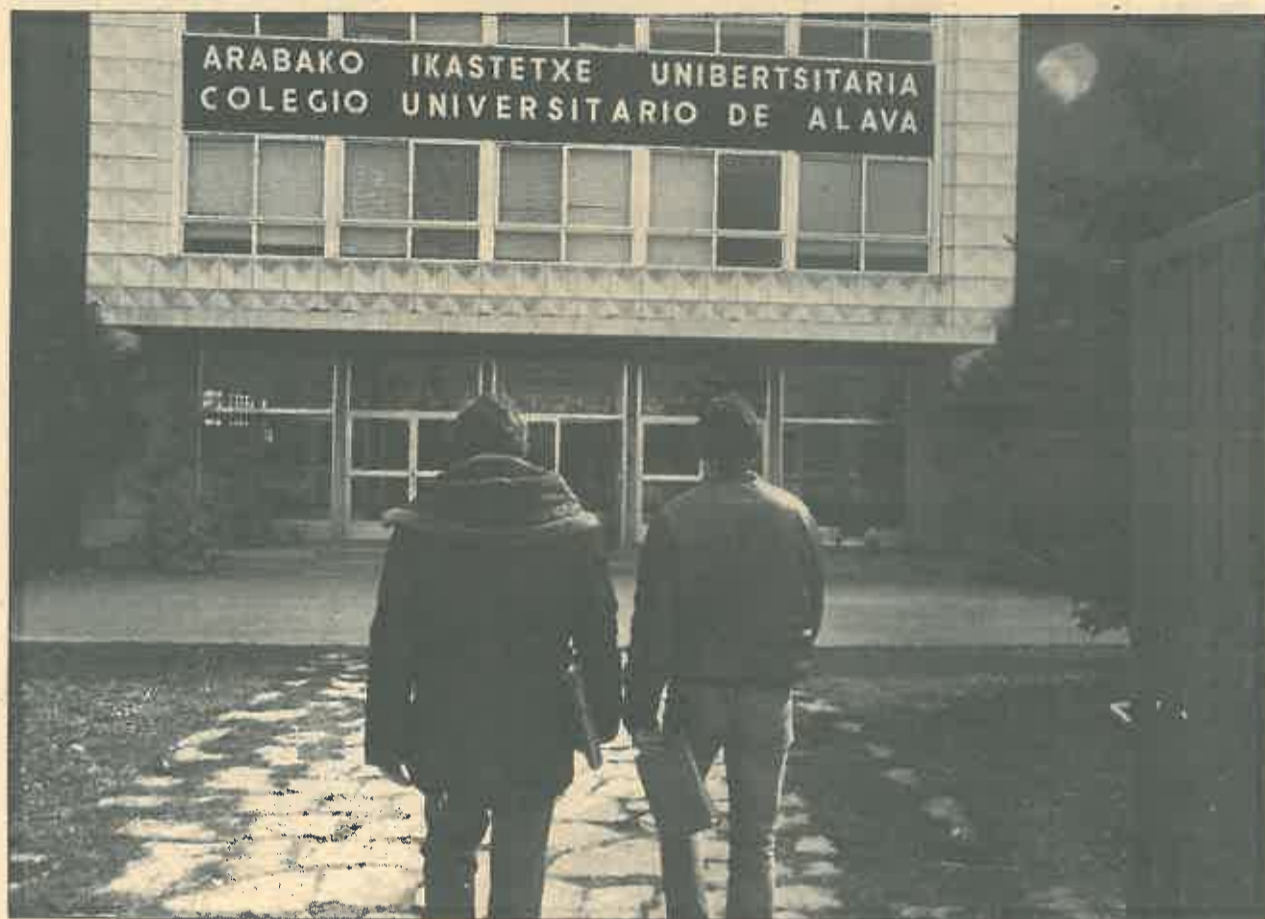
La Facultad de Farmacia estará ubicada en el antiguo Colegio Universitario de Alava