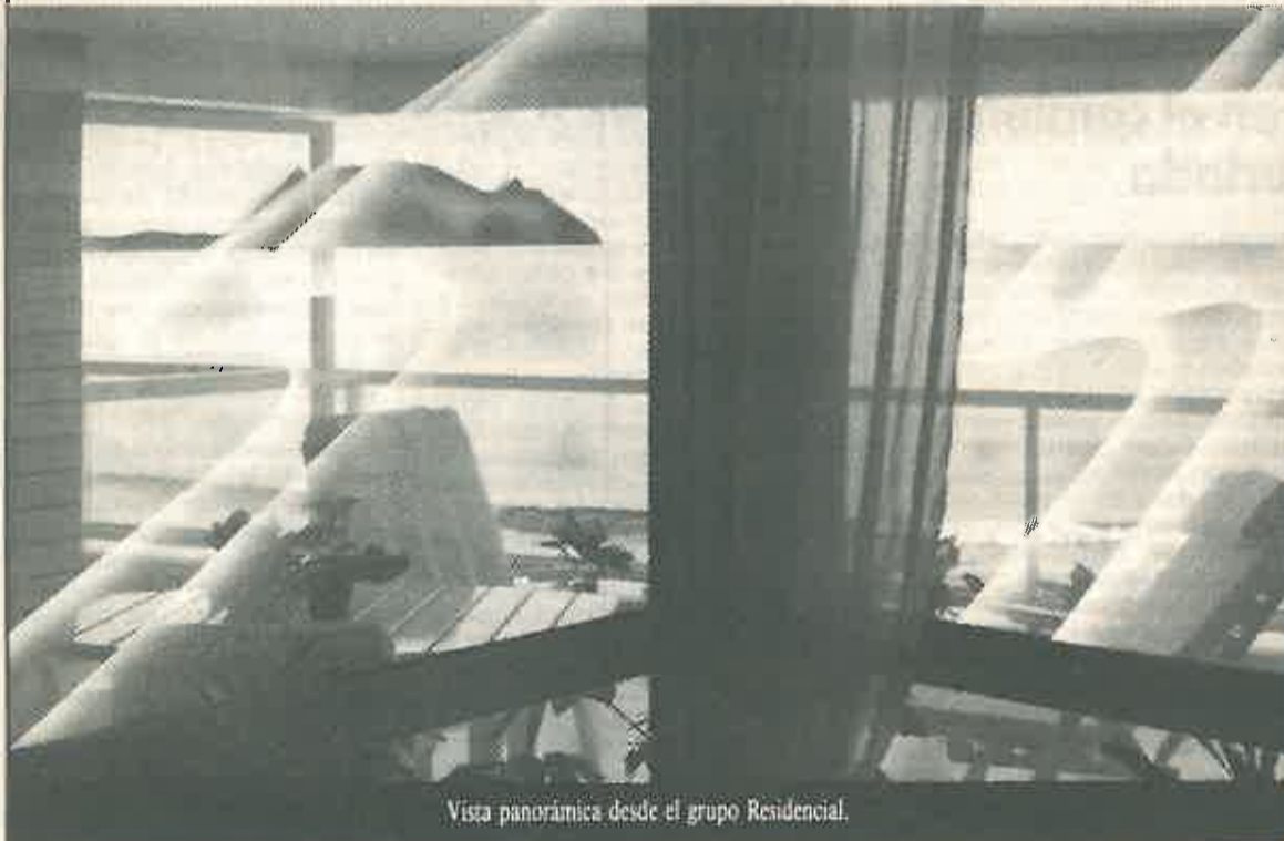
Vista panorámica desde el grupo Residencial.

Situado en 1.ª línea de playa, con parque natural, orientación sur.