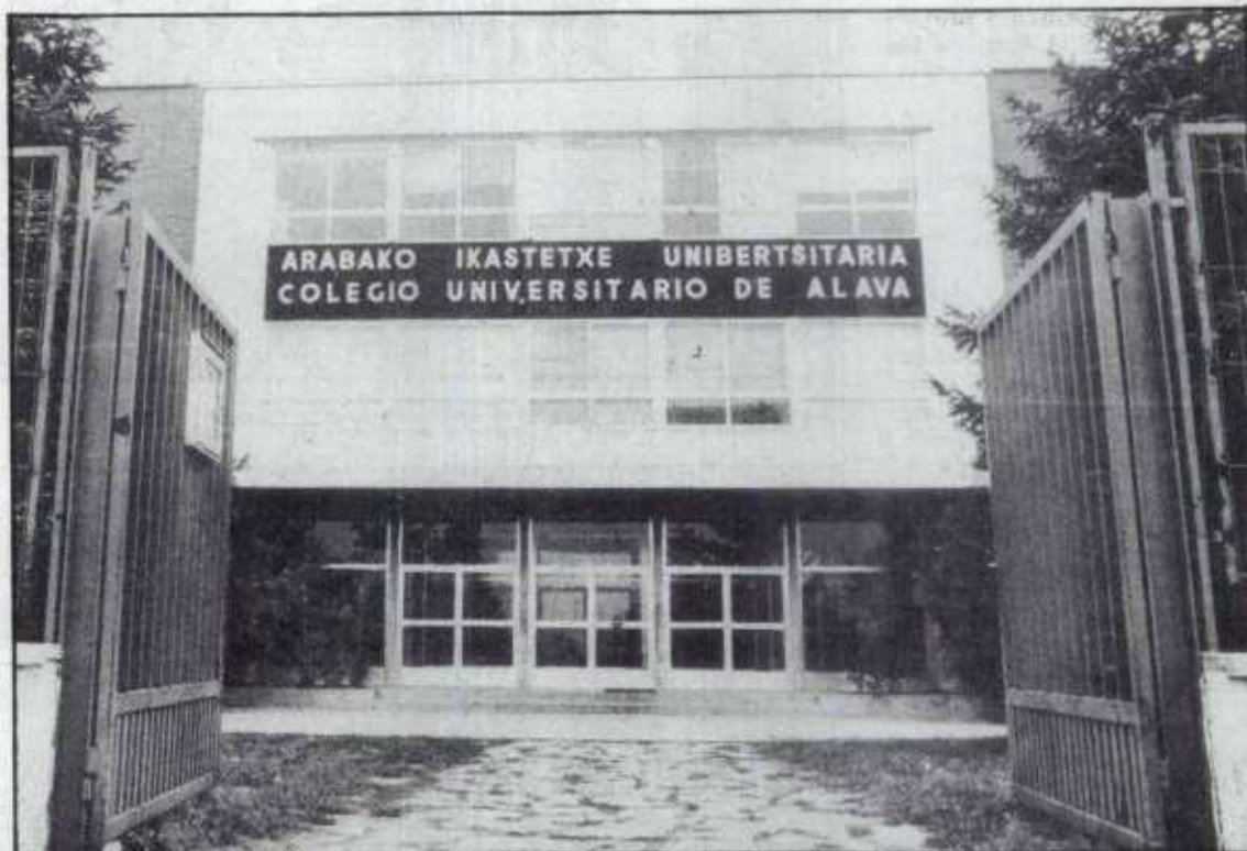
Fachada del Colegio Universitario de Alava, que albergará los estudios de la Facultad de Farmacia.