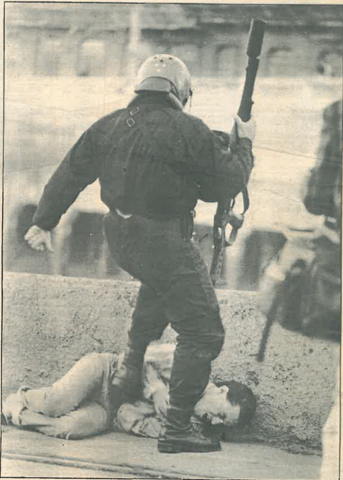
Los manifestantes fueron duramente reprimidos por la Policía autónoma durante los enfrentamientos de ayer.