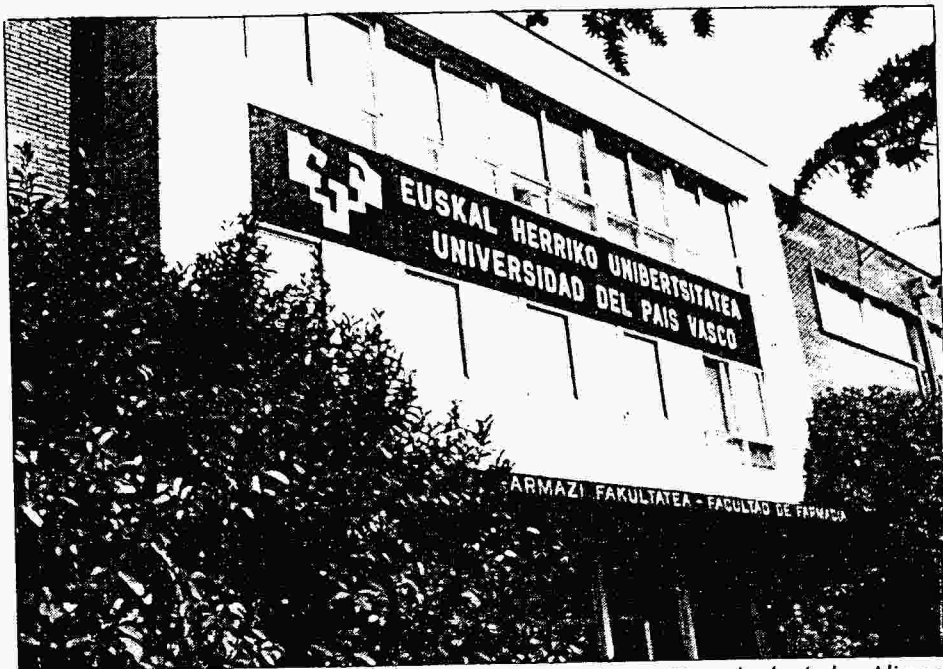
Finalizadas las obras, los estudios de Farmacia, Dietética y Tecnología de los Alimentos abandonarán su ubicación en el antiguo CUA.

Las nuevas instalaciones se convertirán en facultad de Ciencias de la Salud y acogerán los estudios de Farmacia, Dietética y Alimentación Humana y Ciencia y Tecnología de los Ali-