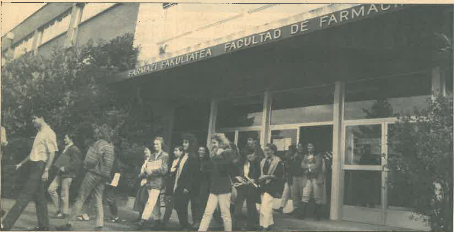
La facultad de Farmacia en Gateiz ha empezado a impartir la carrera este curso.

El programa de asignaturas ha sido el diseñado a partir de un estudio minucioso de los impartidos en otras facultades españolas y europeas.