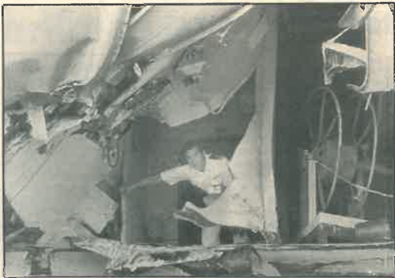
Un oficial norteamericano examina los daños en su barco.

por especialistas de la Armada estadounidense y responsables de la compañía aseguradora española inspeccionó ayer el mercante «Urdúliz». Los responsables de Naviera Vizcaína, armadores del buque, no pudieron llegar ayer al puerto de Norfolk al no conseguir billetes de avión. «Llegarán hoy a las cinco de la tarde —comentó el armador— para evaluar todos los daños. Por las noticias que nos han llegado, el golpe está localizado en la concha de proa, la parte más delantera del barco».