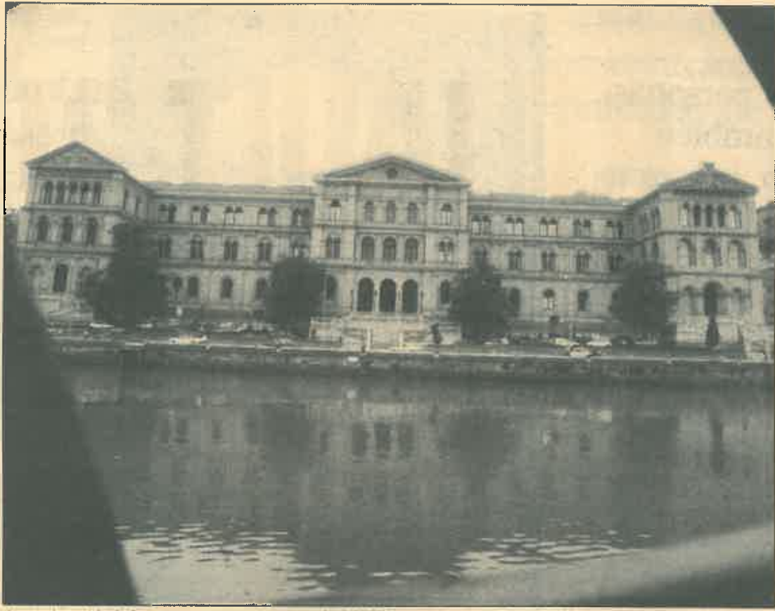
La universidad de Deusto acoge a cerca de 13.000 estudiantes.

L OS estudiantes universitarios del País Vasco desean seguir los pasos de los primeros de la fila: Mario Conde y el príncipe Felipe. Al menos la elección de carrera así parece indicarlo cuando optan por seguir los estudios superiores de Económicas y Derecho. La primera carrera se imparte en el campus de Sarriko de la UPV y a pesar de su alta cifra de «numerus clausus»: 830, resulta insuficiente para los 1.736 que han mostrado su interés en matricularse. En el segundo lugar del ranking se sitúa Derecho, ocupando el primer eslabón en el caso de la Universidad de Deusto: 1.107 y 3.791 respectivamente.