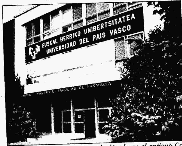
La Facultad de Farmacia está ubicada en el antiguo Colegio Universitario de Alava.

En cualquier caso, los estudiantes que realizan en Vitoria el primer curso están matriculados en las mismas materias que componen el primer año de Farmacia «porque esta carrera