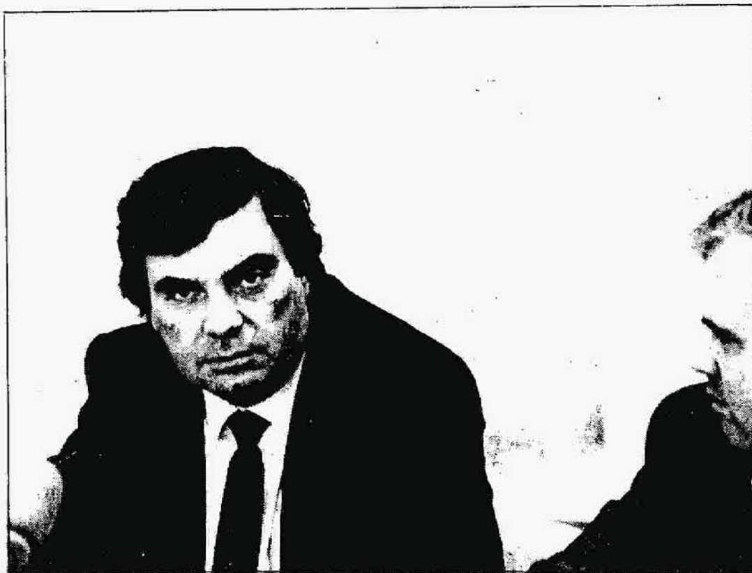
El rector de la U.P.V y el vicerrector del Campus de Araba OLALDE

El Campus Universitario de Araba tiene alrededor de los cuatro mil quinientos universitarios.