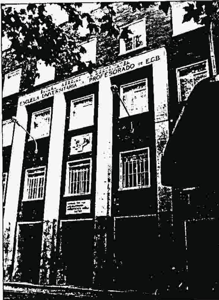
Magisterio puede perder alguna de sus especialidades.

Por otro lado, tal y como aclararon los representantes estudiantiles de la Escuela, "los de segundo y tercero no