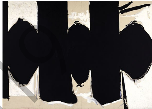
MOTHERWELL: Elegía a la República Española (1957-1961)