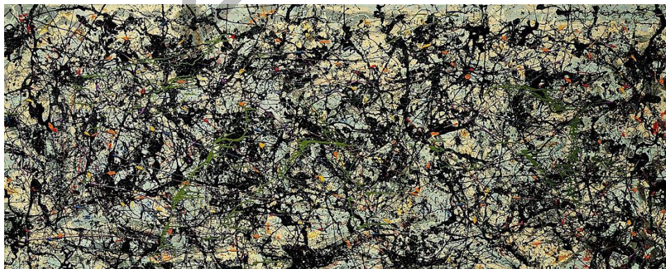
POLLOCK: Lucifer (1947)