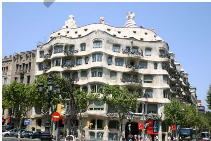
GAUDI: Casa Milà de Barcelona (1906-1910)