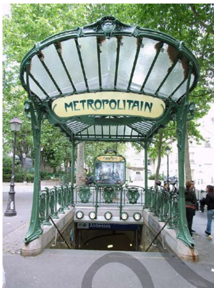
GUIMARD: Entrada de metro de París (1900)

Propuesta de tema: Explica el desarrollo del modernismo.