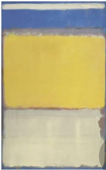
ROTHKO: Número 10 (1950)

Propuesta de tema: Explica el expresionismo abstracto americano.