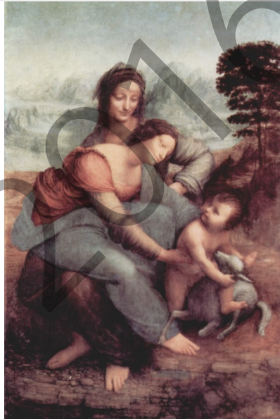
Santa Ana, Ama Birjina eta Jesus haurra Leonardo da Vinci. Santa Ana, la Virgen y el Niño

Analiza estas 2 imágenes (2,5 puntos cada una).