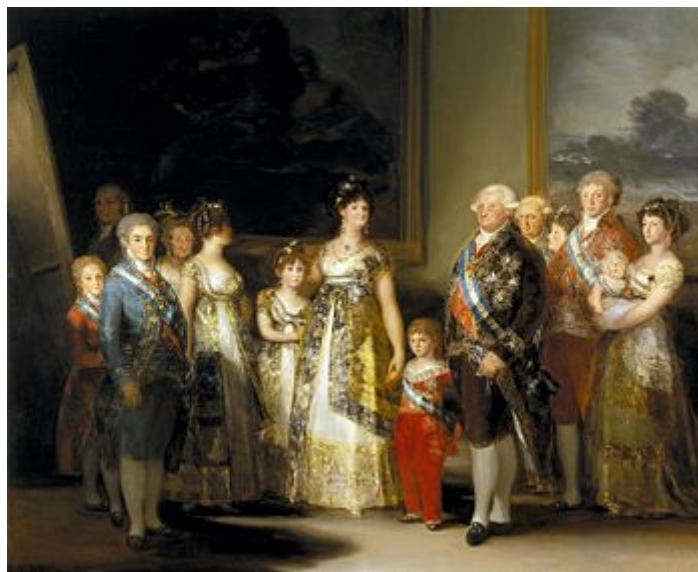
Karlos IV.aren familia. Francisco de Goya. La familia de Carlos IV