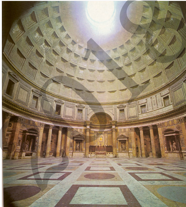
Agriparen Panteoia (Erromako Panteoia) - Panteón de Agripa (Panteón de Roma)

Analiza estas dos imágenes: (2,5 puntos cada una)