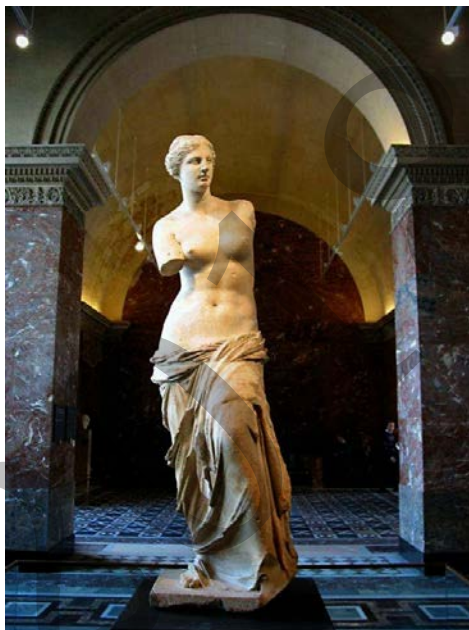
Venus Milokoa - Venus de Milo

Analiza estas dos imágenes: (2,5 puntos cada una)