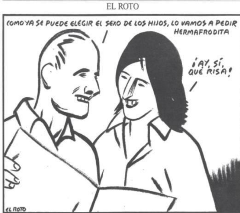
Imagen 4. Viñeta de El Roto publicada en El País, 7 de mayo de 2005 (Platero, 2014)