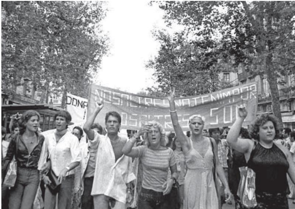
Imagen 3. Foto realizada por Colita en 1977 (Platero, 2014).

Extracto de la Ley 16/1970 de Peligrosidad y Rehabilitación Social (1970), Capítulo Primero «De los estados de Peligrosidad», que en art. 2 dice: