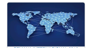
SEMANA INTERNACIONAL 2018