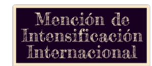
Mención de intensificación internacional