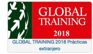
GLOBAL TRAINING 2018 Prácticas extranjero