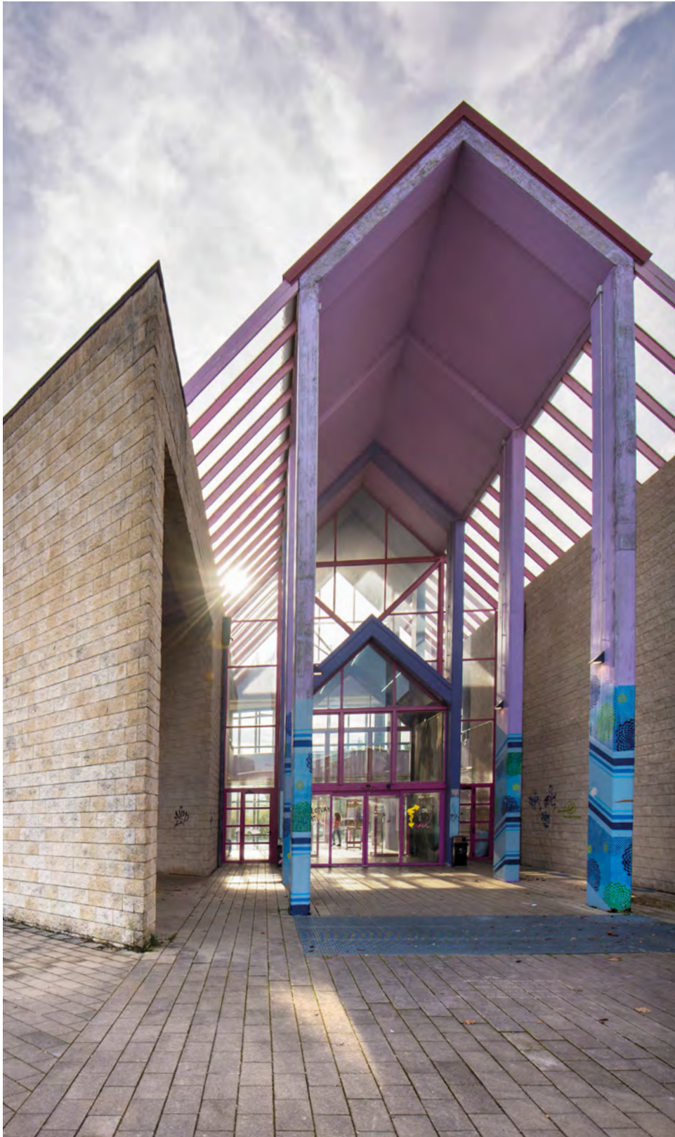
Artea_6. or. / Ondarearen Kontserbazio eta Zaharberritzea_8. or. / Sorkuntza eta Diseinua_10. or.