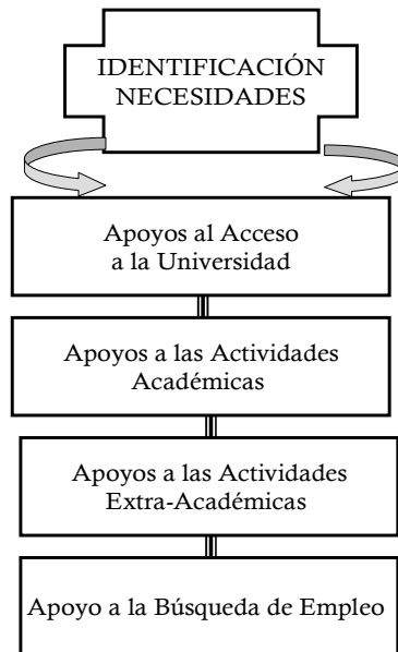
Figura 1: Actividades para las que requieren más apoyo los estudiantes con SA/AAF.

La provisión de apoyos a estudiantes universitarios con SA/AAF en estos cuatro procesos y actividades, tal como se detallará a continuación en el presente Modelo de Apoyos , requiere: