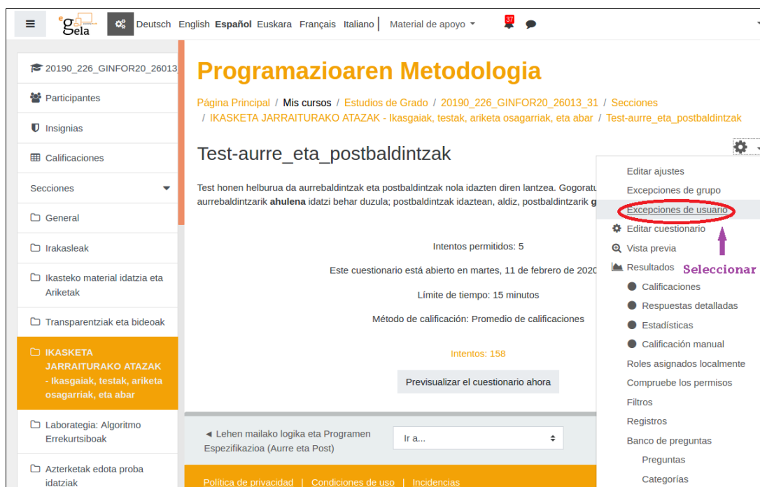
Gráfico 2. Pulsa en el engranaje (o rueda) que aparecerá en pantalla