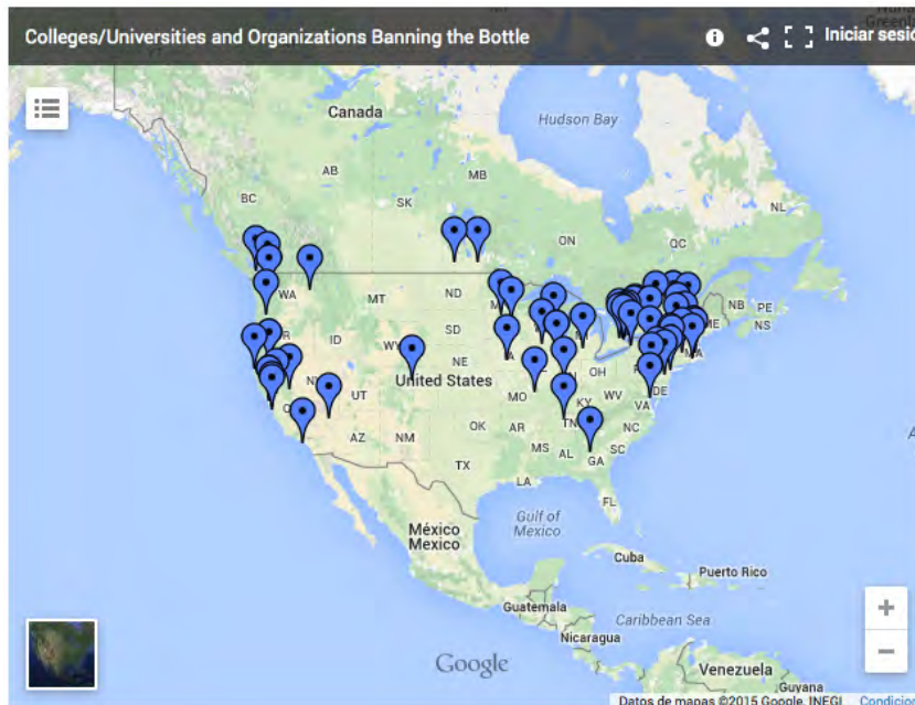
Figura 1. Mapa de los EEUU y de Canadá que incluye la localización de aquellas universidades y escuelas que han puesto en marcha algún tipo de iniciativa para prohibir el consumo de botellas de plástico en sus instalaciones (Fuente: Ban the Bottle , http://www.banthebottle.net )