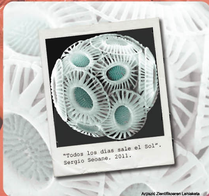
Argazki Zientifikoaren Lehiaketa

SGIkerrek ezagutza eta prestazioak eskaintzen dizkiete UPV/EHUko eta beste zentro publiko edo pribatuak ikertzaile eta teknologoei, eta baita enpresei ere, hitzartutako zerbitzuak betetzeko hitzarmen edo kontratuen bidez.