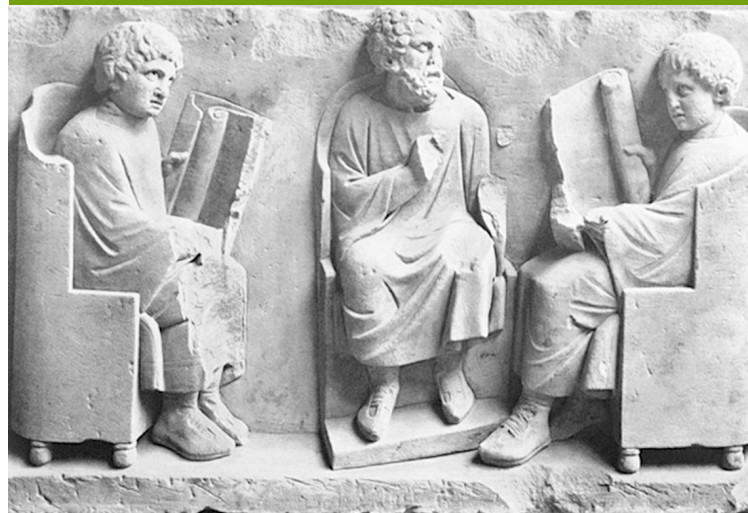
Noviomagus (Neumagen-Dhron, Alemania). Rheinisches Landesmuseum Trier

23-24 DE NOVIEMBRE DE 2015 - 2015ko AZAROAREN 23tik 24ra