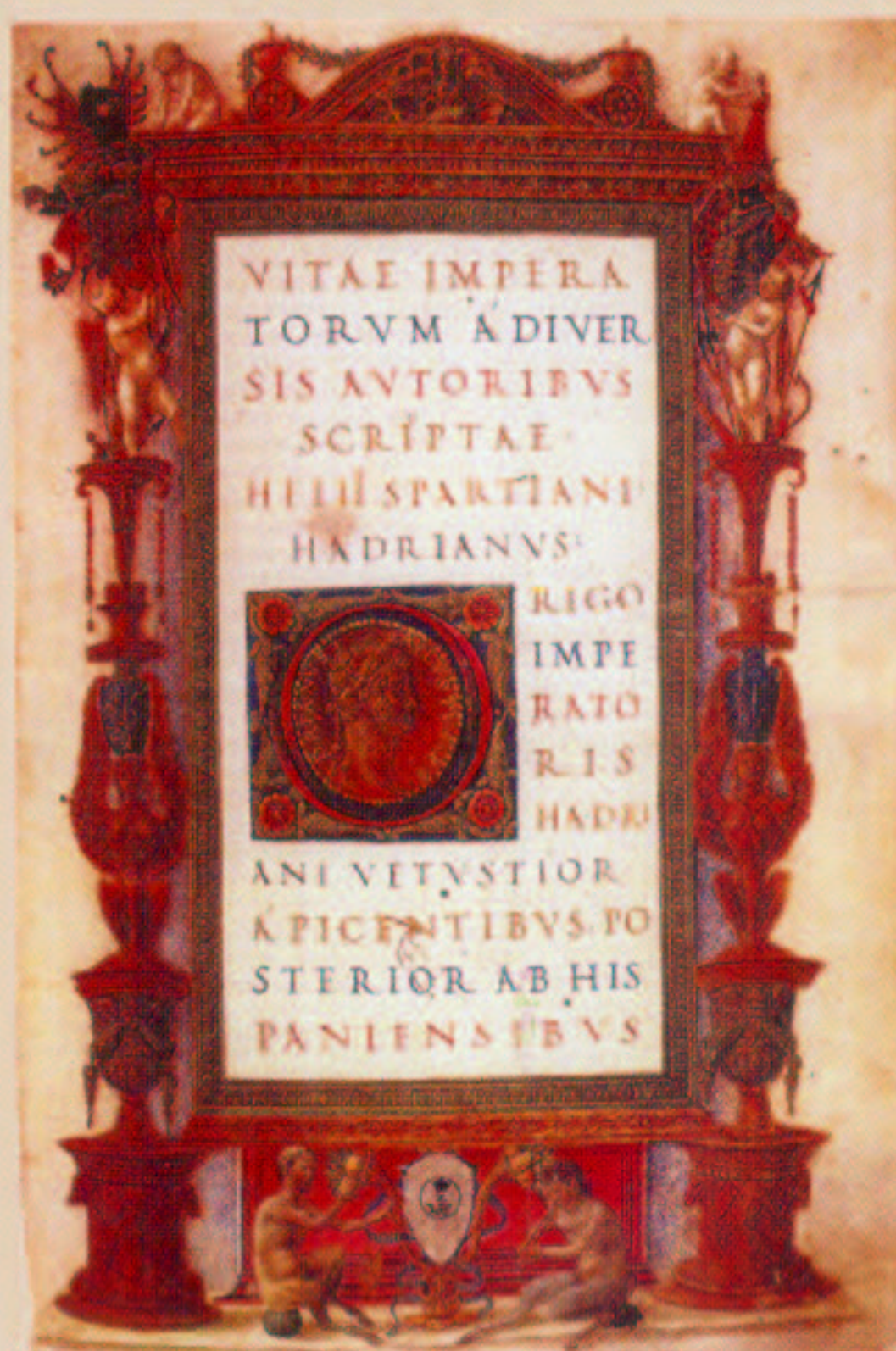
[PARIS, BIBLIOTHÈQUE NATIONALE, LAT. 10848, F. 5V]

Filologia eta Geografi-Historia Fakultatea Euskal Herriko Unibertsitatea Elurretako Gradu Aretoa