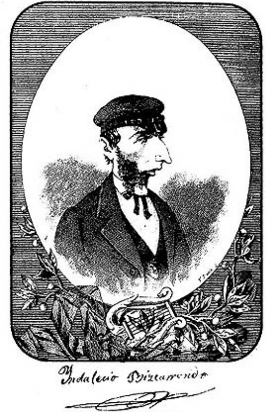
Biktoriano Iraolak egindako erretratua

Indalezio Bizkarrondo «Bilintx» Triste bizi naiz eta