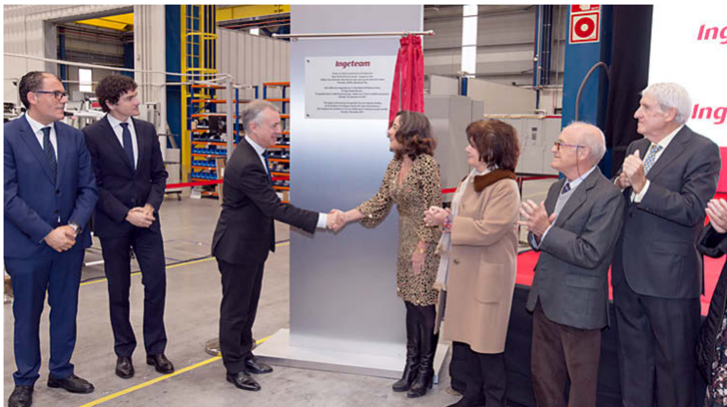
El 'lehendakari' Iñigo Urkullu saluda a los directivos de Ingeteam.

El Grupo Ingeteam cerró el pasado ejercicio con una cifra de negocio de 637 millones de euros. Esta cifra supuso un incremento del 47 por ciento desde el inicio del plan estratégico en 2016 hasta 2018. El 82 por ciento del negocio de Ingeteam