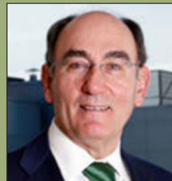
Ignacio Sánchez Galán Presidente de Iberdrola