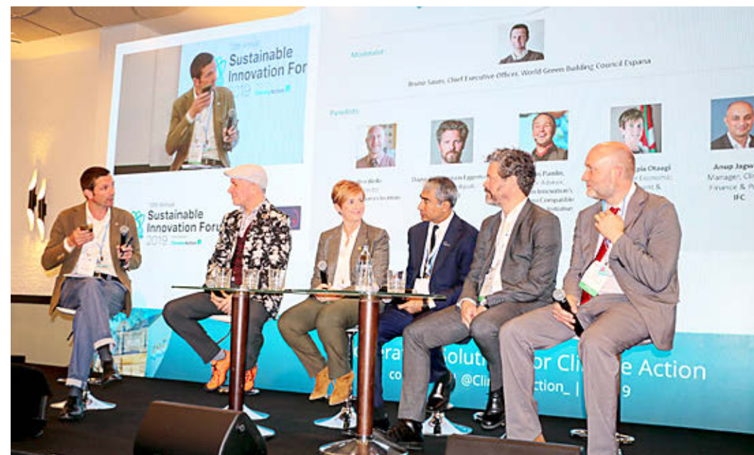
La consejera de Desarrollo Económico e Infraestructuras del Gobierno vasco, Arantxa Tapia, en un encuentro en Madrid en la Cumbre del Clima.

■ Arantxa Tapia participó en la sesión de alto nivel del 'Foro Sustainable Innovation Forum', un evento oficial de la COP25 que compartió con ministros de asuntos económicos, energía y medio ambiente de países, principalmente, nórdicos. Además, una treintena de empresas vascas acudieron con el Gobierno vasco a Madrid y ayudaron en los paneles dedicados a la Movilidad Sostenible y las Oportunidades de Negocio en la Transición Energética. También se analizaron los retos de futuro del sistema energético vasco que suponen una oportunidad para el tejido industrial.