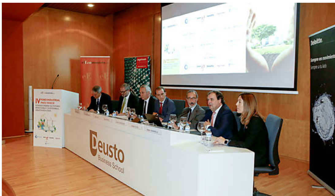
La mesa redonda del IV Foro Industrial País Vasco de 'elEconomista' contó con importantes representantes de la empresa y la economía.