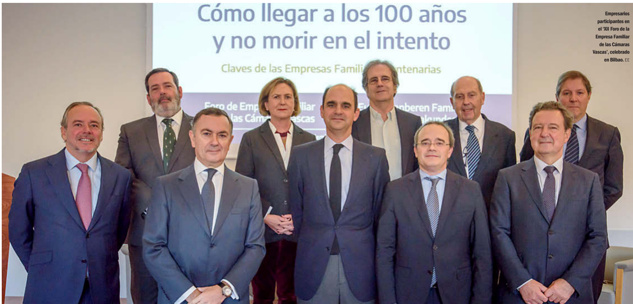
Empresarios participantes en el 'XII Foro de la Empresa Familiar de las Cámaras Vascas', celebrado en Bilbao. EE