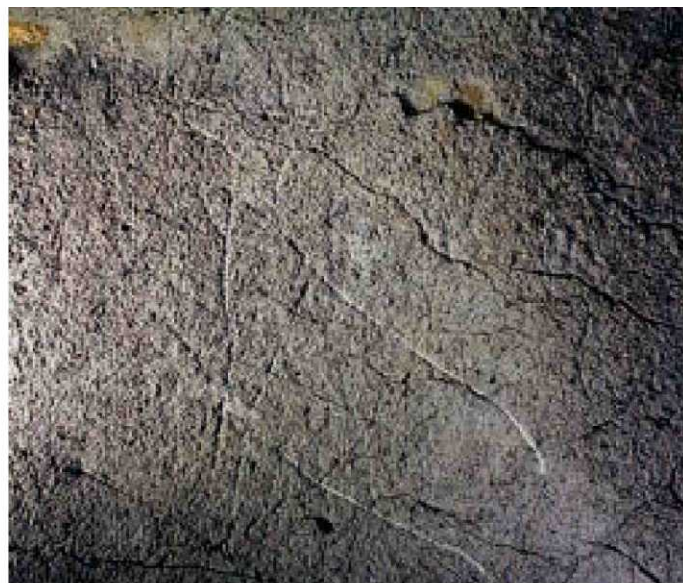
Ezkerreko irudian, uro baten burua; eskuinekoan, orein eme batena. Ikerlariek grabatuak zuriz markatu dituzte argazkietan, animalien irudiak hobeto ikuste aldera. ANTXIETA ELKARTEA