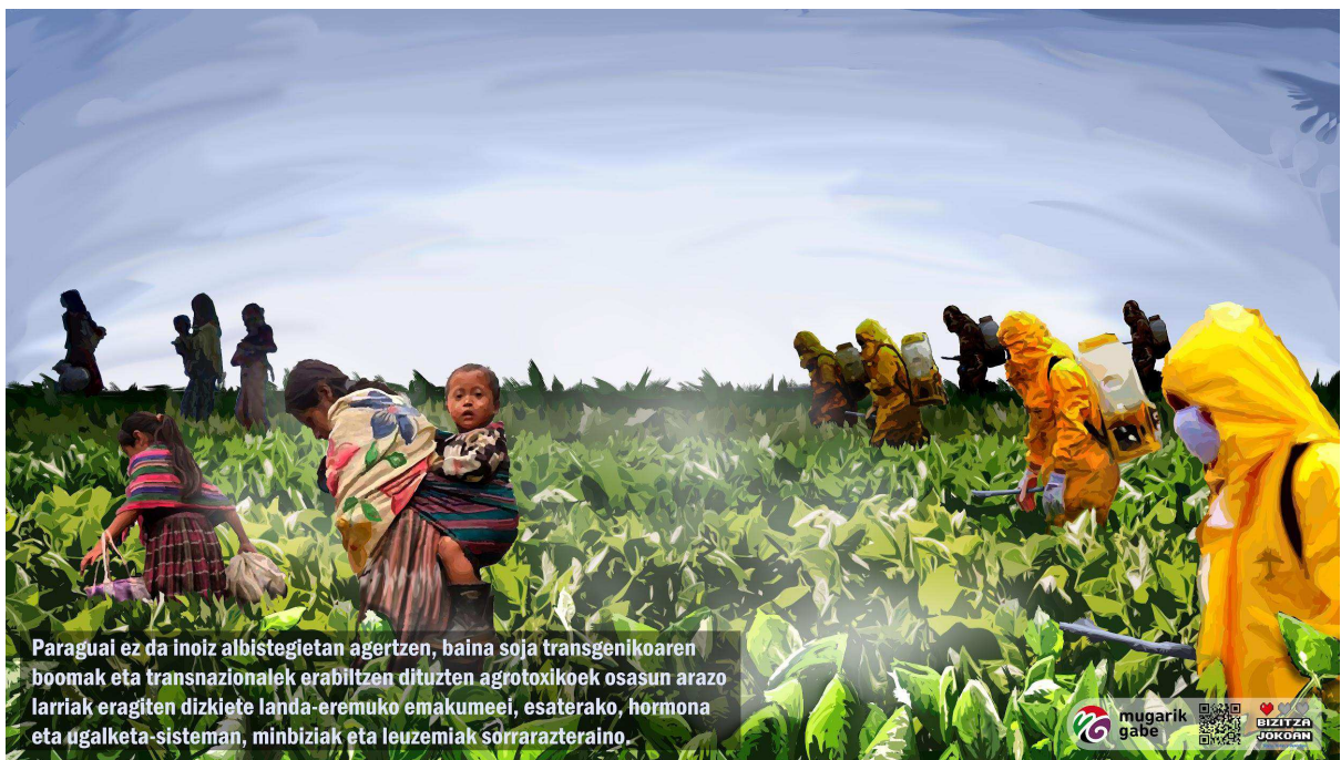
Paraguay ez da inoiz albistegietan agertzen, baina soja transgenikoaren boomak eta transnazioalek erabiltzen dituzten agrotokioek osasun arazo larriak eragiten dizkiete landa-eremuko emakumeei, esaterako, hormona eta dgalketa-sisteman, minbiziak eta leuzemiak sorrarazteraino.