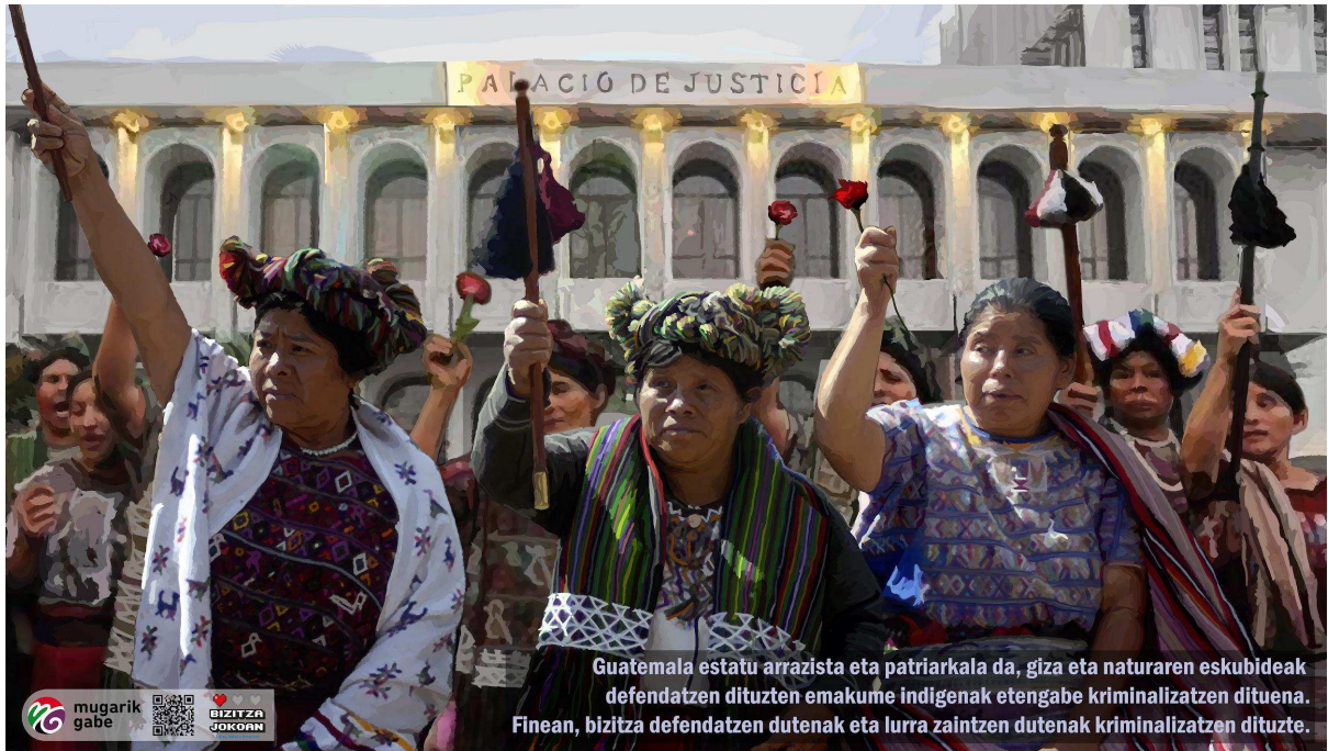
Guatemala estatu arrazista eta patriarkala da, giza eta naturaren eskubideak defendatzen dituzten emakume indigenak etengabe kriminalizatzen dituenak. Finean, bizitza defendatzen dutenak eta lurra zaintzen dutenak kriminalizatzen dituzte.