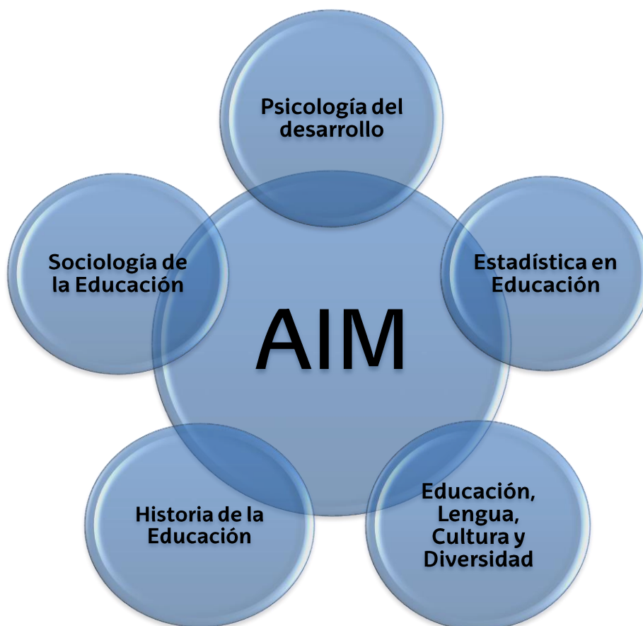
Gráfico 1. Asignaturas y AIM que componen el módulo "contextos educativos"

La estructura del módulo contempla el desarrollo de las cinco asignaturas mencionadas, y la AIM (Actividad Interdisciplinar del Módulo) como se expresa en el gráfico 1 (ver gráfico).