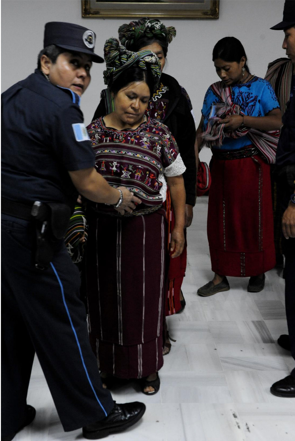
Mujeres Ixiles sometidas a revisión en la entrada de una audiencia en un Tribunal guatemalteco en donde se juzgó las violaciones cometidas contra la población ixil por parte del Ejército de Guatemala en los años 80.