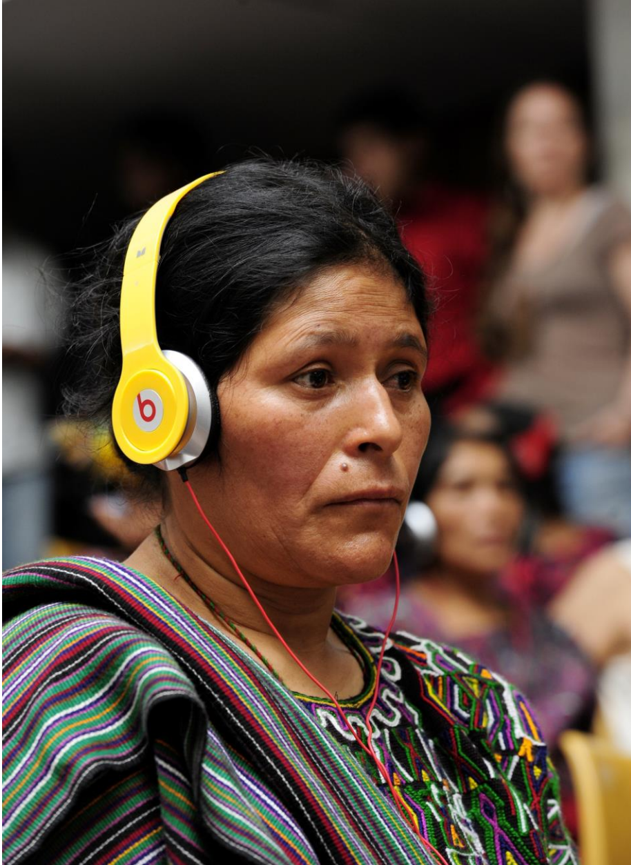
Una mujer Ixil escucha una de las audiencias en el Juicio por Genocidio contra el ex dictador Efraín Ríos Montt en Mayo de 2013. Ciudad de Guatemala