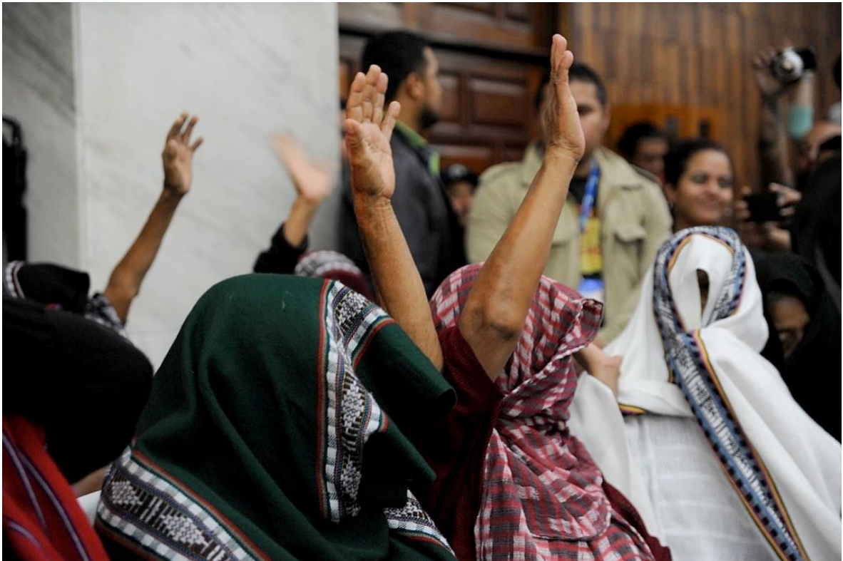
Mujeres celebran durante la sentencia del Caso Sepur Zarco en donde se condenó a un Ex comisionado Militar y el Teniente Reyes , por los delitos de esclavitud sexual y esclavitud domestica ejercida contra mujeres mayas q`ueqchís en un destacamento militar en los años de 1980 a 1981.