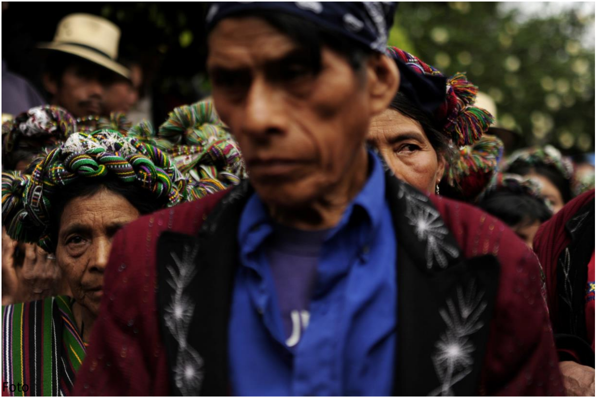
El pueblo Ixil realiza un acto en conmemoración de las víctimas del genocidio en la Plaza de Nebaj Quiché, luego de que el Tribunal declarara culpable al Ex dictador Efraín Ríos Montt. Junio de 2013.