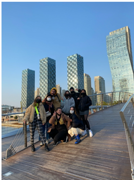
Central Park (Incheon)

Te recomiendo hacerte con una tarjeta de crédito que no de problemas ni cobre comisiones muy altas a la hora de pagar con moneda extranjera o sacar dinero fuera de España.