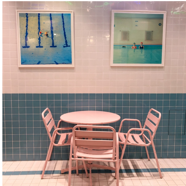
Cafetería dentro de una tienda (Myeondong)

En general, la vida en Seúl es bastante fácil y aunque no se habla mucho en inglés no tendrás problemas para ubicarte, coger el metro o comunicarte en tiendas o restaurantes (siempre con el traductor Papago en el móvil).