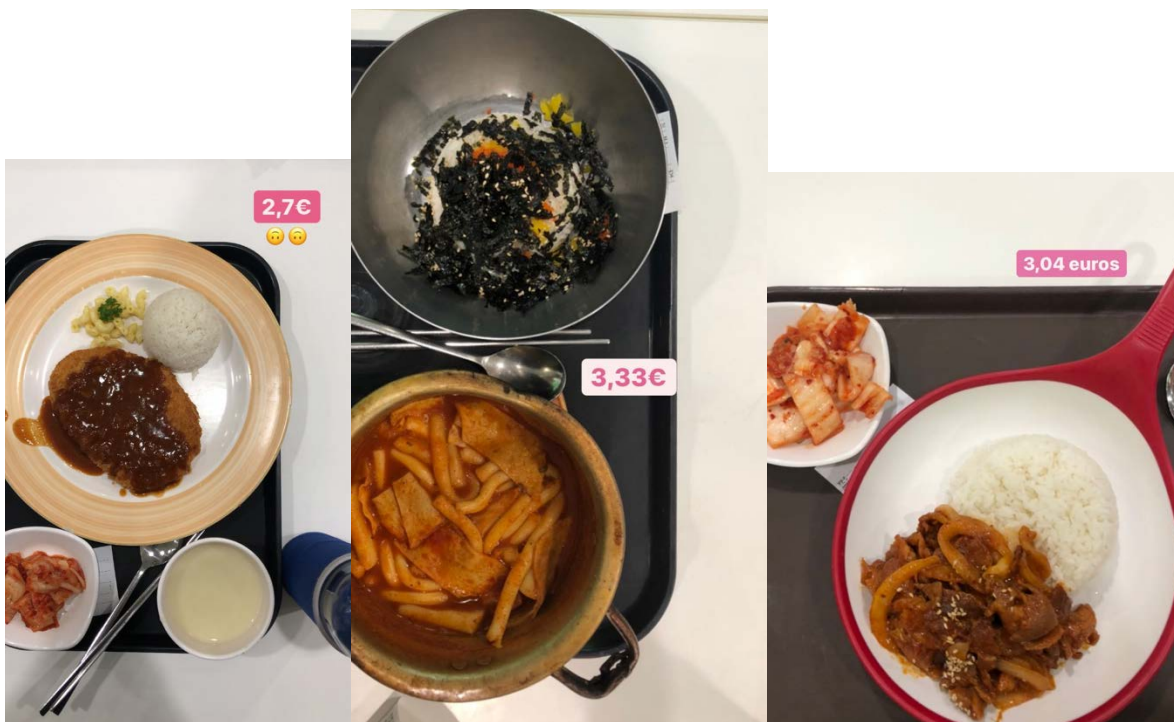
Platos de las cafeterías de la Universidad