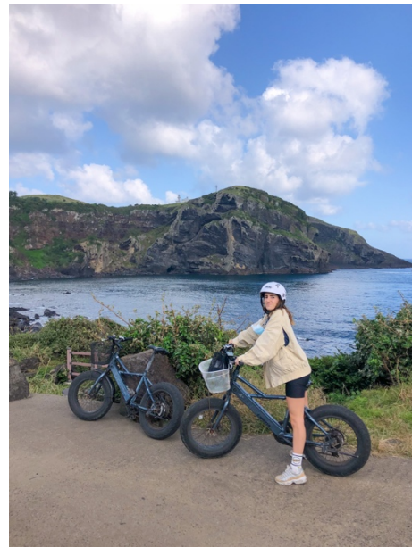
Jusangjeolli Cliff y Udo Island (Isla de Jeju)