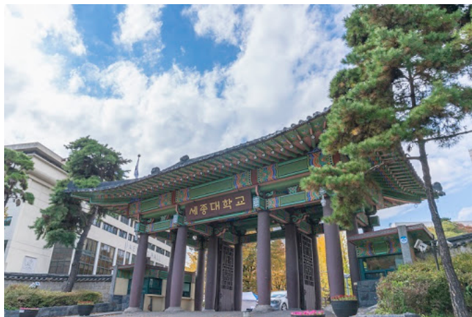
Entrada de la Universidad de Sejong

La Universidad se encuentra entre las diez mejores de la ciudad y cuenta con doce facultades : Business Administration, Hospitality Tourism Management, Natural Sciences, Social Science, Electronics and Information Engineering, Life Sciences, Engineering, Arts & Physical Education, Open Major, Liberal Arts y Software Convergence. También tiene escuelas de posgrado.