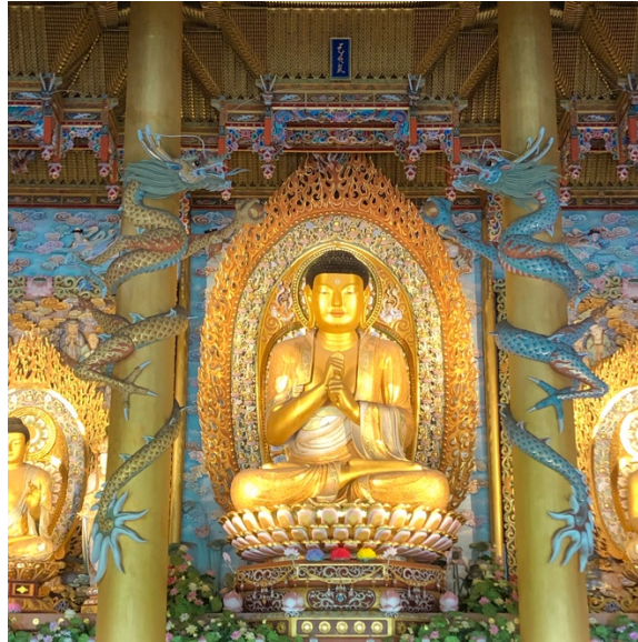
Yakcheonsa Temple (Isla de Jeju)

En Corea como moneda se usa el won coreano , siendo 1 euro aproximadamente 1320 won. El nivel de vida es bastante parecido al de España. Si bien hay cosas que son más caras, otras son muchísimo más baratas. Comprar fruta y verdura puede ser bastante caro (aunque siempre puedes encontrar precios asequibles en mercados callejeros), mientras que comer en un restaurante es barato (4-8 euros). El transporte público cuesta alrededor de 1 euro el viaje y todo está perfectamente comunicado a través de metro o autobús. Incluso puedes llegar a otras ciudades, como Incheon, a través de metro.