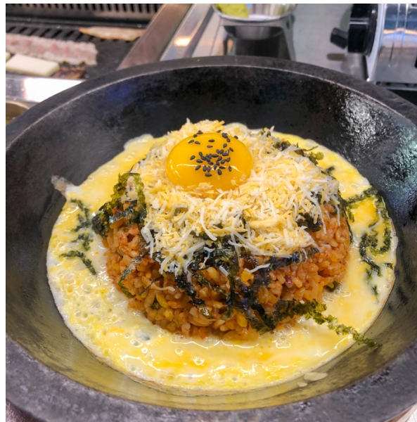
Kimchi fried rice