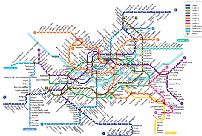
Metro de Seúl y mapa