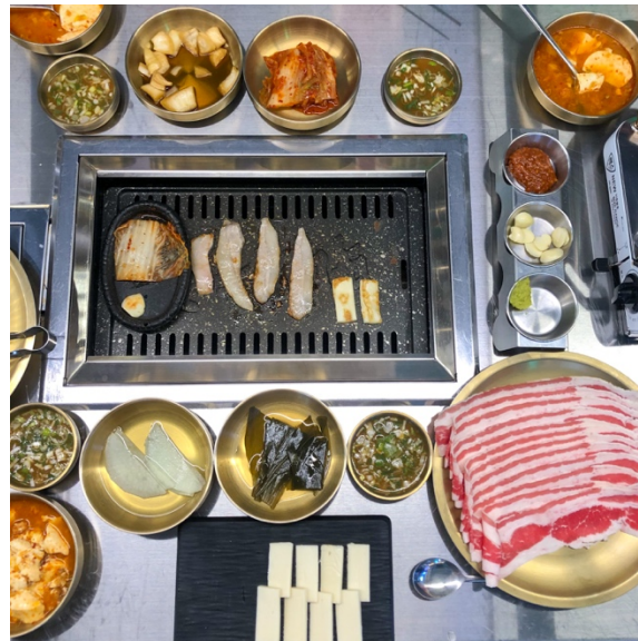
Barbacoa típica coreana

En cuanto a la comida es muy diferente a la española y tienes que estar preparado para comer picante (aunque existen también muchas opciones para los que no le guste) y arroz a todas horas. Casi toda la comida coreana es picante o dulce. Si bien, al ser una ciudad muy moderna, no es difícil encontrar comida de otras partes del mundo, hamburgueserías, pizzerías, italianos e incluso restaurantes españoles. Tampoco dejes de probar la comida callejera, sobre todo en mercados como el de Gwangjang Market.