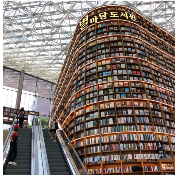
Coex Mall (Gangnam)

Algunas zonas que te recomiendo visitar si vienes a Seúl son Hongdae, Gangnam, Dongdaemun, Insadong, Itaewon y por supuesto Kondae y Seongsu, los más cercanos a la Universidad de Sejong. También se encuentra muy cerca el río Han que cruza toda la ciudad y puedes recorrer en bicicleta pública.