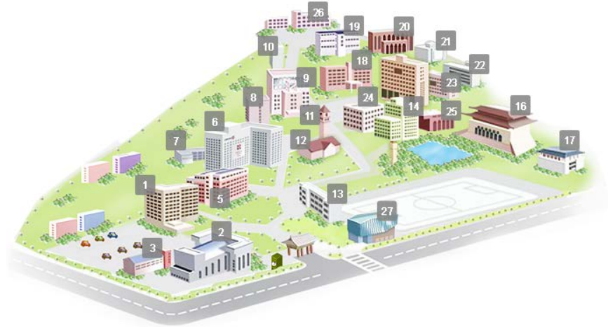
Mapa del Campus

El campus es mediano en comparación con otras universidades de Seúl, pero tiene de todo: tiendas de conveniencia, farmacias, restaurantes, residencias de estudiantes, salas de exposiciones, biblioteca, papelería, banco, cajeros y cafeterías en las que puedes almorzar y cenar a muy buen precio (2-4 euros) y tienen bastante variedad de platos.