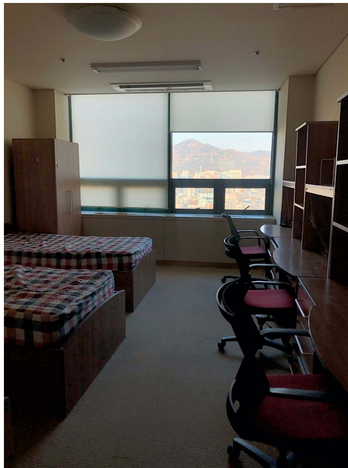
Habitación de chicas de la residencia

Hay una residencia para estudiantes internacionales que se encuentra en la planta 13, para chicas, y 14, para chicos, del edificio Gwangaetto, el mismo donde se imparten la mayoría de clases. Recomiendo mucho vivir en la residencia, ya que tiene un precio bastante asequible (650-750 euros por un cuatrimestre), las instalaciones están bastante bien y es muy conveniente. Las habitaciones son compartidas entre 3 personas, para chicas, y entre 4 para chicos. Hay cocina común, nevera en las habitaciones, agua filtrada, salas de estudio y wifi. Además, es donde conocerás a otros estudiantes internacionales y te facilita mucho a la hora de hacer amigos. Algo positivo es que, si bien oficialmente hay toque de queda como en muchas residencias de Corea, en ésta no se cumple y podrás entrar con la tarjeta de estudiante a cualquier hora.