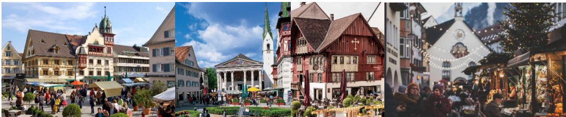
1. Irudia. Dornbirn City Center.

Dornbirn, izatez hiri bat da (50 000 biztanle), baina egia esan ailegatu nintzen unetik nire ikuspuntutik herri baten antzekoa dirudi. Izan ere Alpe-tako herri txiki baten antzera da ia etxe gehienak Alpe-tako etxeak dira eta, batzuk berriagoak beste batzuk zaharragoak baina guzti guztiak esentzia ezberdin batekin eta gehienak zurezkoak.