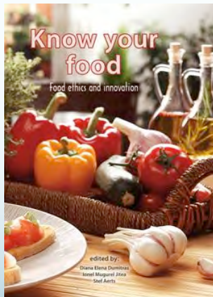
Know your food! Food Ethics and Innovation Universidad de Cluj-Napoca, Rumanía 2015