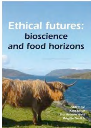
Biociencias y horizontes alimentarios Universidad de Nottingham, 2009