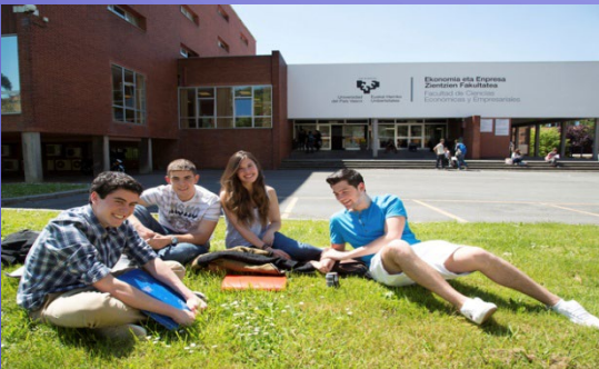
Bilbo - Sarriko