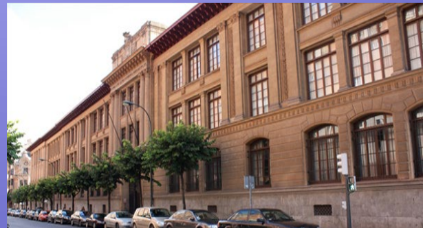
Bilbo - Elkano