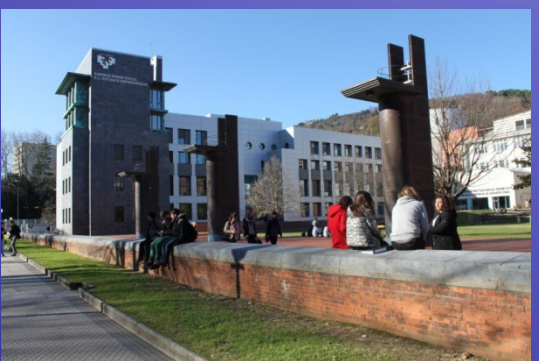
Donostia / San Sebastián