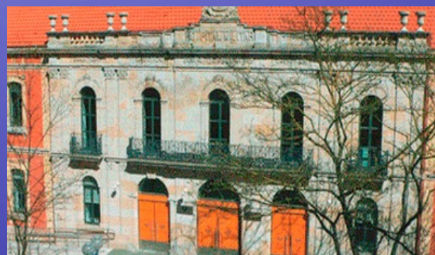
Vitoria - Gasteiz