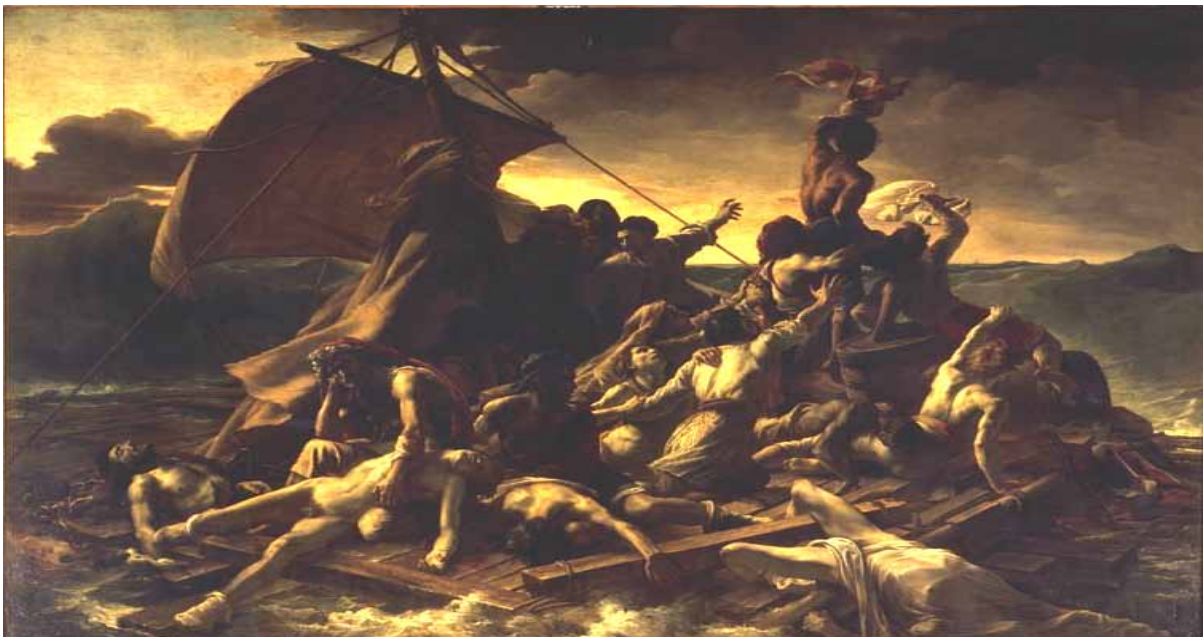
Gericault: "Medusa"-ren txalupa / La balsa de La Medusa.