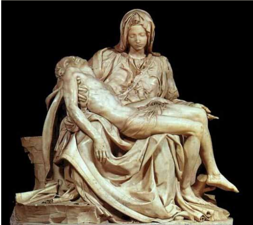
Miguel Ángel: La Pietá

Analiza estas 2 imágenes. (2,5 puntos cada una)