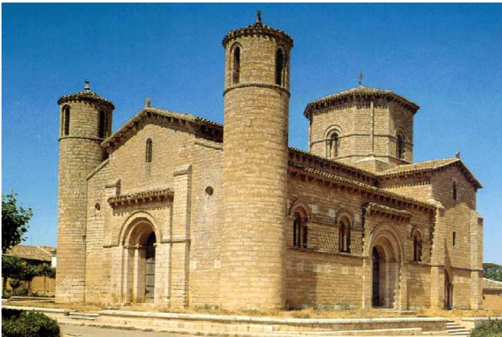
San Martín de Frómista. Palencia.

Analiza estas 2 imágenes. (2,5 puntos cada una)