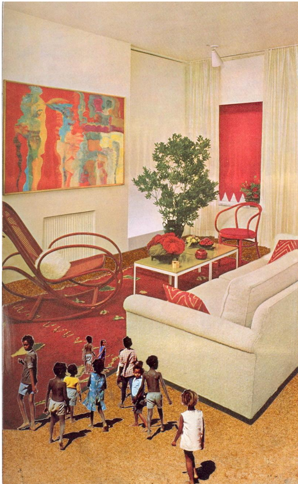
PHILLIP ESTLUND, Adventures in Interior Design , 2007