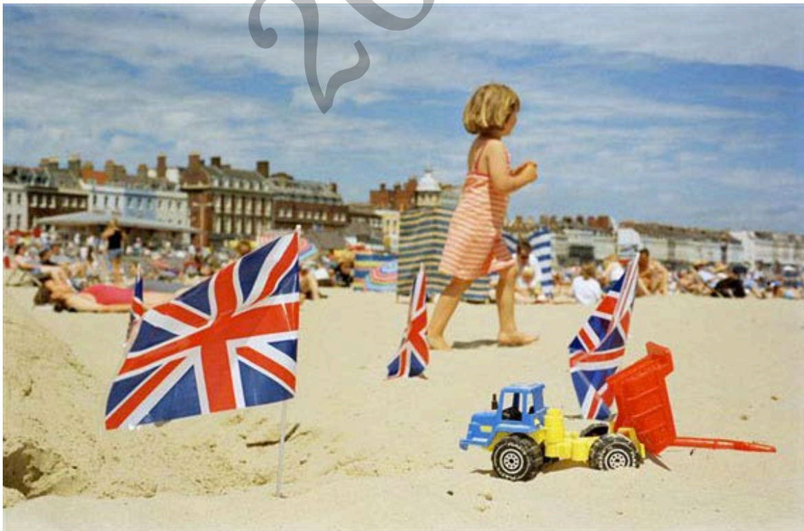
MARTIN PARR , Weymouth, England, GB, 1998. from Life's A Beach