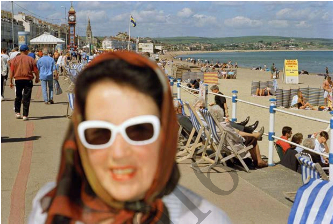
MARTIN PARR , Weymouth, England, GB, 2000. from Life's A Beach