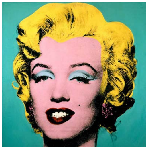
Andy Warhol. Marilyn Monroe