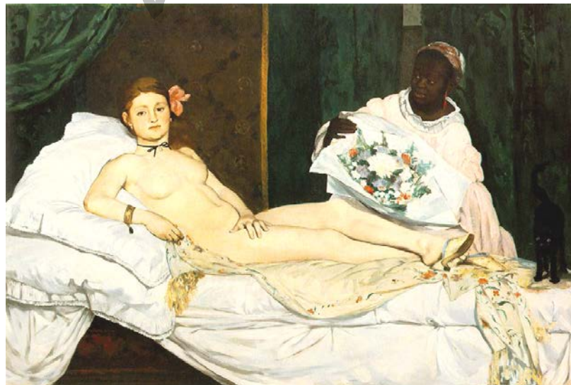
Edouard Manet. Olympia