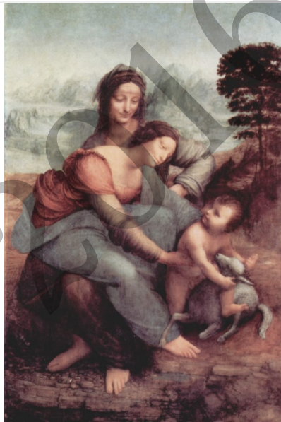
Santa Ana, Ama Birjina eta Jesus haurra Leonardo da Vinci. Santa Ana, la Virgen y el Niño