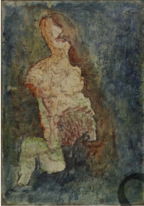
FAUTRIER: Sarah (1943)