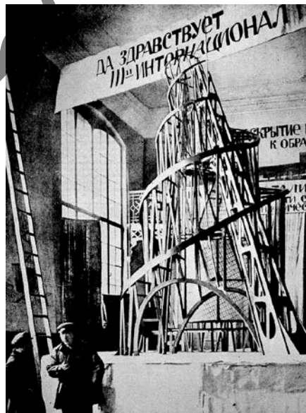
TATLIN: III. Internazionalari egindako monumentuaren maketa (1919)