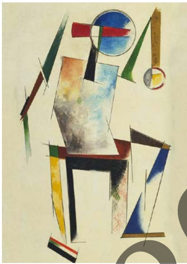
STEPANOVA: Figura (1921)

A. Gai-proposamena: Azaldu konstruktibismo errusiarraren garapena.